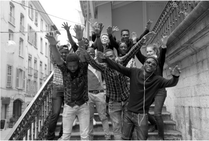
Les membres du Bureau des dépositions.