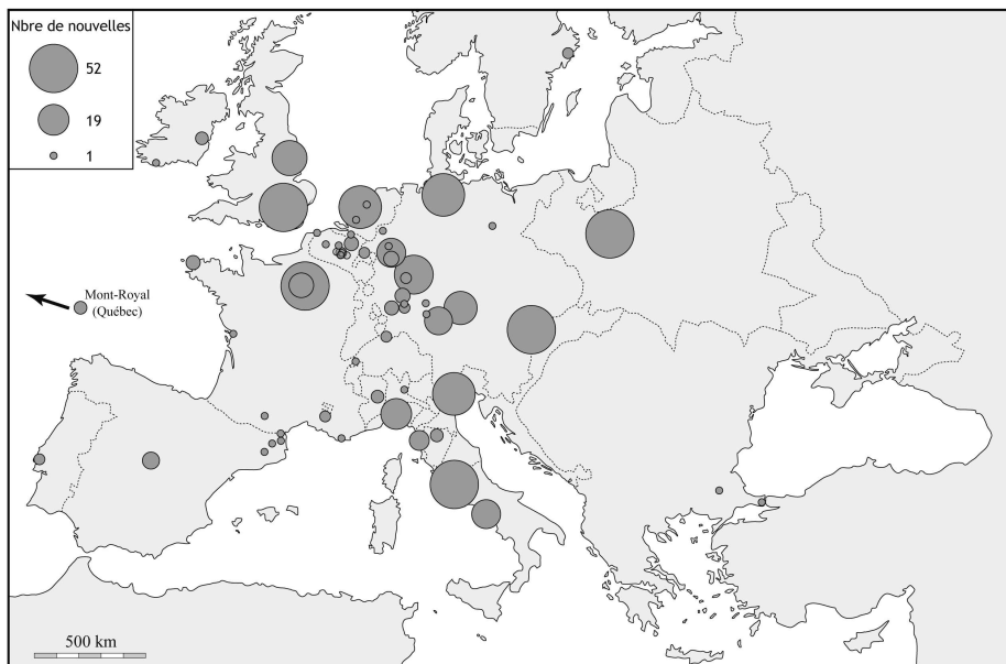
Provenance des nouvelles de la Gazette en 1689