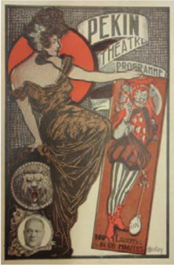
Ill. 1: Illustration du programme du Pekin Theatre Chicago, c. 1906, Manuscripts and Rare Books Library, University of Columbia, HLFP, Box 36.