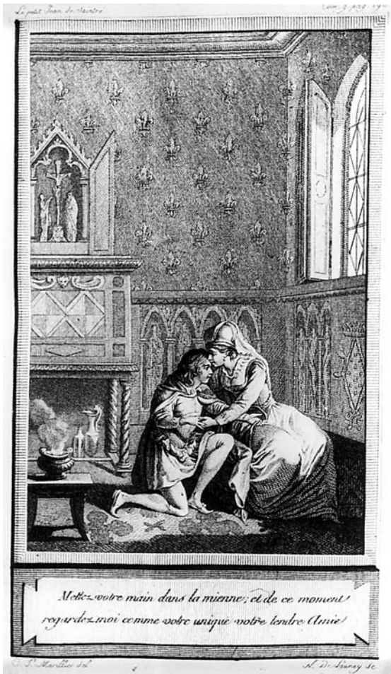
III. 1 – Pierre-Clément Marillier, illustration pour le Petit Jehan de Saintré , 1788.

salles des XIII e , XIV e et XV e siècles avaient frappé les imaginations par le jeu de l'ombre, l'accumulation des pièces et la dramatisation des effigies funéraires.