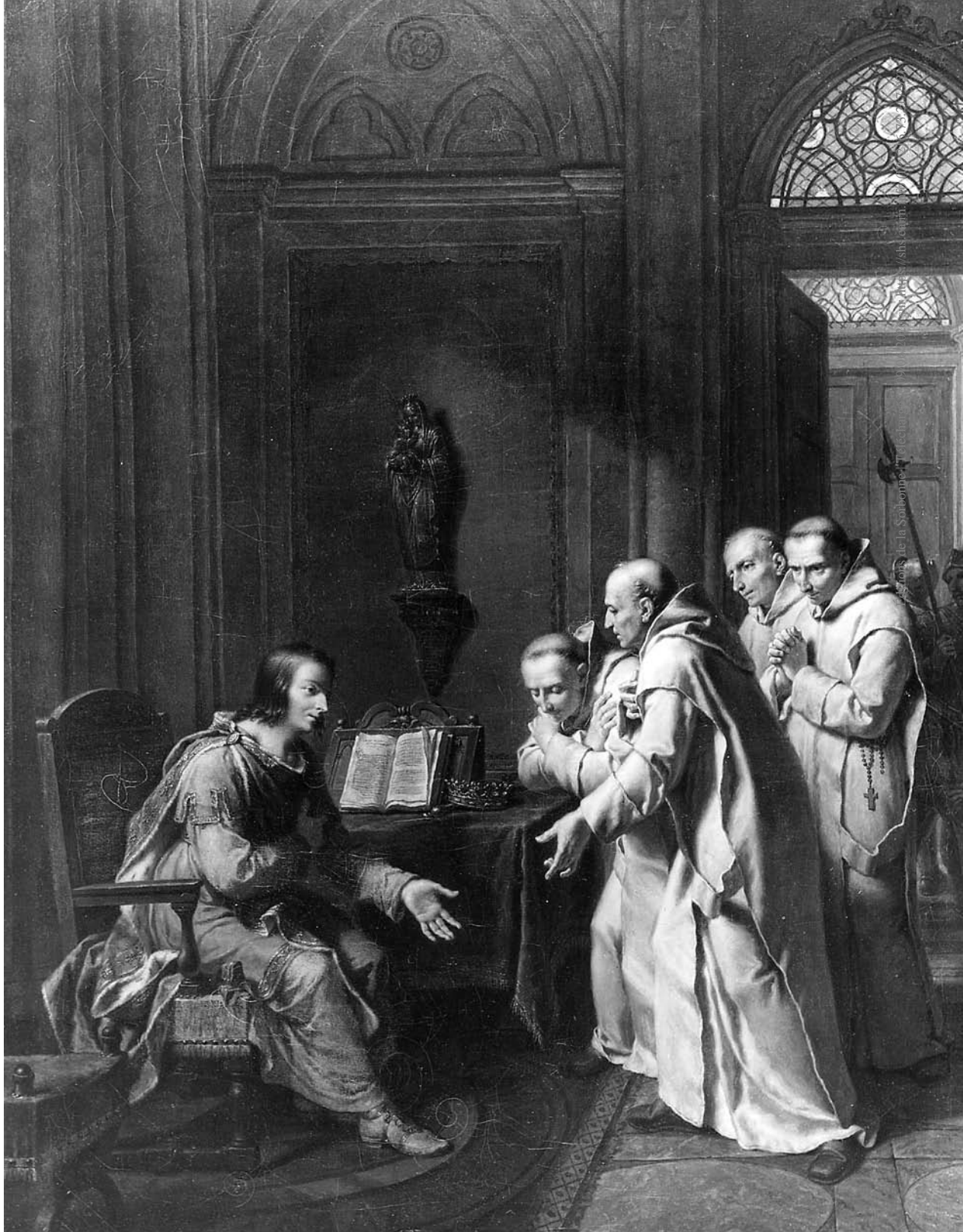
III. 2 – Nicolas-André Monsiau, Établissement de l'Ordre de Saint-Bruno , 1824, musée de Clamecy.