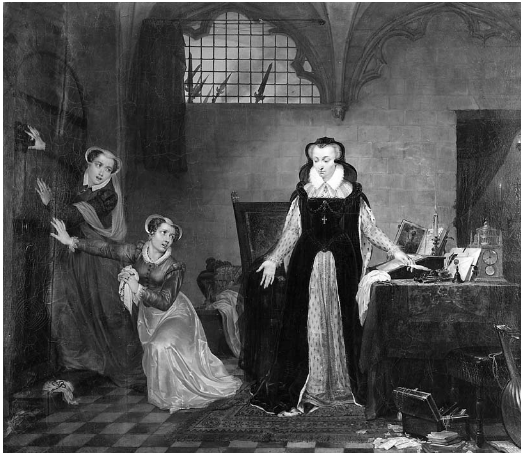
Ill. 3 – Philippe-Jacques Van Brée, Marie Stuart au moment où on vient la chercher pour aller à la mort , 1819, Musée des Beaux-Arts, Tourcoing.