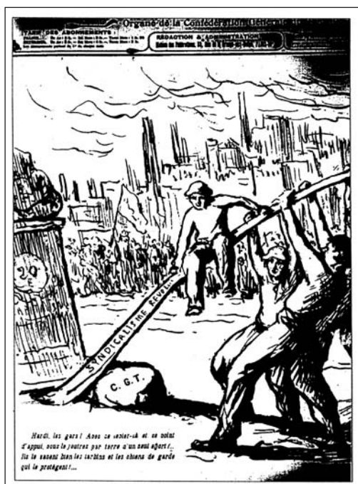
▲ ill. 14.

modèle de « L'Action syndicale » ! Le Bâtiment, qui sert classiquement de modèle de cette action avant la guerre 48 , est le lieu privilégié de ce face-à-face comme dans ce dessin du Premier Mai 1909, qui vise à montrer que l'organisation fait la force (ill. 13).