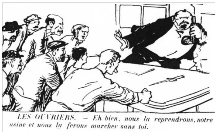
▲ ill. 5.

D'un strict point de vue revendicatif, l'iconographie du journal ne s'attarde pas sur les salaires, hormis de brèves allusions à la « thune » – 5 francs – que protège le Dieu-capital et aux 20 francs qu'exigent les cheminots 30 . La question des pensions n'est pas mieux traitée à l'exception notable d'une charge féroce contre les conditions d'accès à la « retraite des morts » 31 . Les pancartes et les calicots représentés, pour ne rien dire des légendes, insistent, en revanche, sur les huit heures dont on connaît l'importance cruciale dans la propagande et l'identité cégétistes.