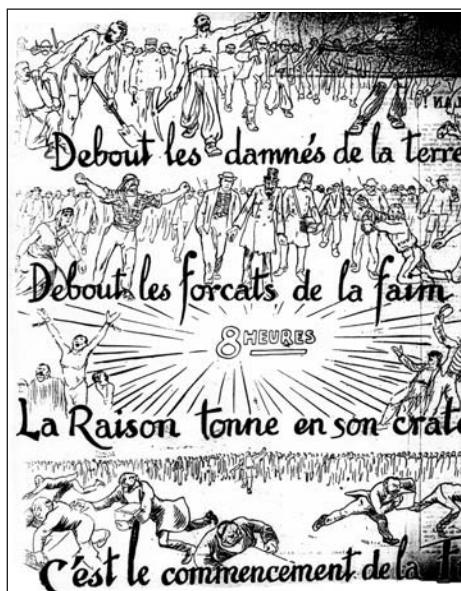
▲ ill. 9. Grandjouan, La Voix du Peuple , 1 er mai 1906.

Exploité, le peuple se définit par son appartenance au monde du travail et, au premier chef, à celui des ouvriers. Le contraire étonnerait dans cet hebdomadaire. La modernité syndicale fait bon ménage, sur ce point, avec un populisme récurrent prompt à ériger l'ouvrier en figure emblématique du peuple. Dans l'optique des dessinateurs, le prolétariat, âme du mouvement social, entraîne et libère. Les plans quasi cinématographiques de la une du Premier mai 1906 offrent une composition saisissante de cette mission émancipatrice (ill. 9). Authentifiée par les légendes, l'identité