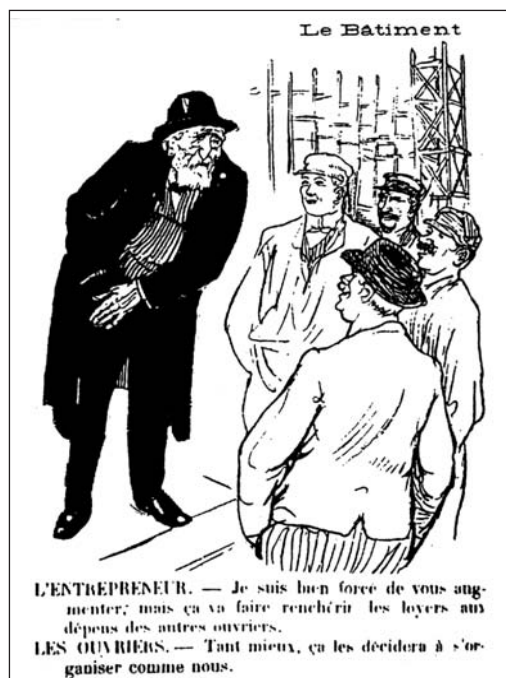
▲ ill. 13.