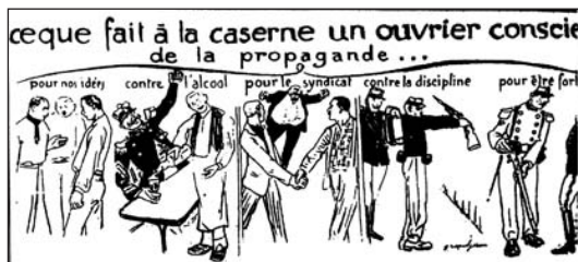
▲ ill. 10. Grandjouan, La Voix du Peuple , février 1907.

Quelques images peuvent toutefois être dégagées de ce corpus limité. D'abord les dessins tendent à montrer que le syndicat, c'est l' union des travailleurs. On le voit ainsi lors de la première apparition du syndicat dans les dessins du journal en février 1907 : c'est l'image des mains qui se serrent qui apparaît alors (ill. 10). Forme symbolique qui va traverser