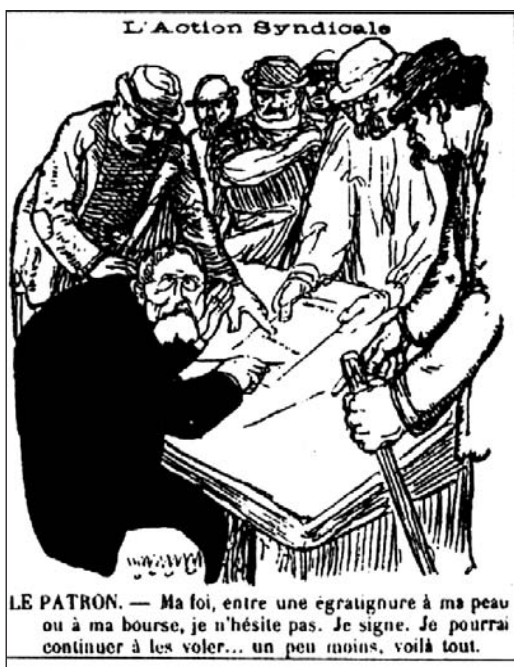
▼ ill. 12.