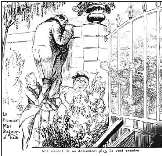
▲ ill. 6.