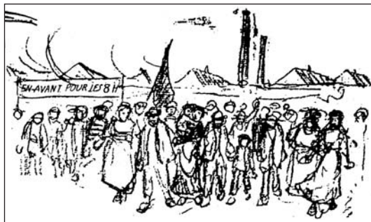
▲ ill. 8.

La Voix du Peuple mérite pleinement son nom. Alors que les textes parlent surtout des « travailleurs » et des « ouvriers », les dessins font la part belle au « peuple ». Comment désigner autrement les foules représentées à profusion ? Anonymes, les silhouettes à peine ébauchées d'hommes, de femmes, d'enfants,