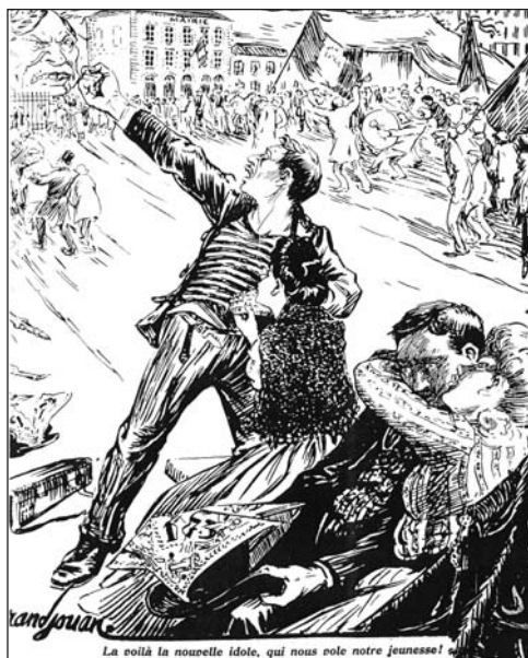
▼ ill. 3.