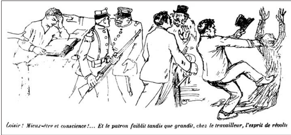
▲ ill. 4.

de quitter le travail avant la nuit, mais signale aussi l'entrée dans une ère nouvelle 24 . Ici, l'avenir radieux esquisse les contours de l'utopie. Sur un mode plus systématique, la démarche est au cœur des séries construites sur l'opposition hier, aujourd'hui/demain ou « ce qui est »/« ce qui doit être » 25 . On reste sur le même registre lorsque, classiquement, les dessinateurs donnent à voir des types de lieux, d'acteurs, d'événements imaginaires, mais cependant assimilables à des espaces, des personnages et des faits précis, concrets, vécus.