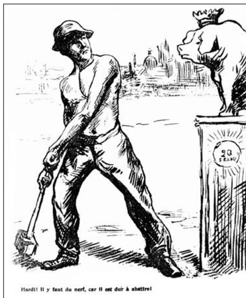
▲ ill. 2.

Les plus « réalistes » ne refusent pas les commodités de l'allégorie et de la symbolique. Entre l'ironie et l'indignation, tel auteur iconoclaste substitue le cochon au veau d'or ( ill. 2 ) 22 . Tel autre figure l'État sous les traits d'une idole monstrueuse et avide de sacrifices humains ( ill. 3 ) 23 . À l'inverse, le généreux soleil croqué par Grandjouan dans le dessin intitulé « Résultat des 8 heures », évoque, certes, la possibilité