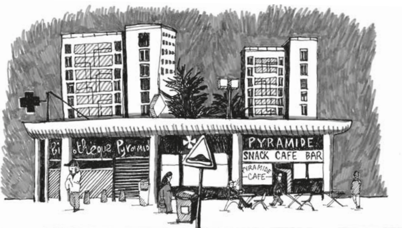
Quartier Pyramide, les Minguettes

Éditions de la dernière lettre | Téléchargé le 08/06/2026 sur http://www.digitalebooks.fr (IP: 193.50.216.136)