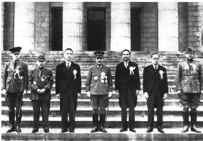
Fig. n° 6 : La Conférence de la Grande Asie orientale, 5-6 novembre 1943 (de gauche à droite, les représentants de la Birmanie, du Mandchoukouo, de la République de Chine [Nankin], du Japon, de la Thaïlande, des Philippines, de l'Inde).