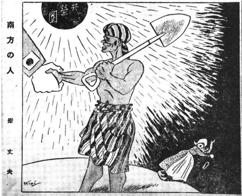
Fig. n° 1 : « Peuple du sud », dessin paru dans Osaka Puck, un magazine de bande dessinée, en décembre 1942, illustrant la libération du peuple indonésien par le Japon 58 .

(Source : John W. Dower, War Without Mercy : Race and Power in the Pacific War , Pantheon, 1986, p. 200.)