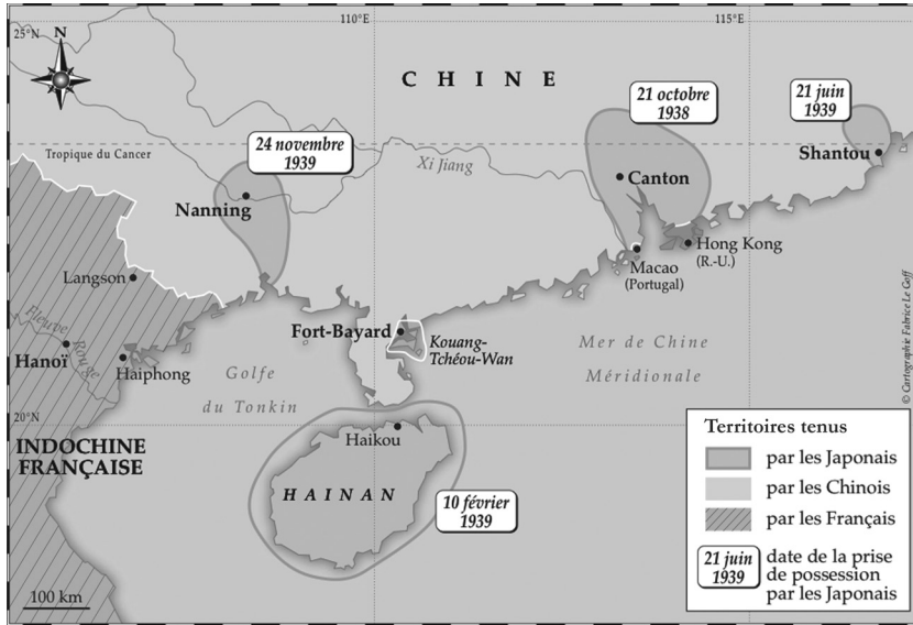
Carte : Zones occupées par les forces armées japonaises en Chine méridionale (1938-1939)

Si bien qu'au moment où la guerre éclate en Europe, le Japon est enlisé en Chine. Sans but de guerre précis autre que d'obliger la Chine à reconnaître son hégémonie et sans espoir d'abattre le régime de Chiang Kai-shek par une victoire décisive, bloqué dans ses ambitions en direction de la Sibérie, le Japon est dans une impasse, isolé diplomatiquement. C'est la raison pour laquelle il se déclare neutre au début du conflit européen.