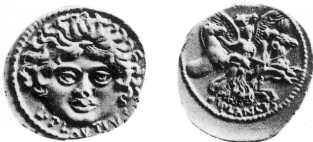
Fig. 2. — Denier de L. Plautius Plancus

« (...) selon l'usage de son époque, il est a priori probable qu'il choisit de représenter, sur l'avers ou le revers des pièces qu'il frappait, des figures évoquant des scènes de la vie réelle ou légendaire de quelqu'un des anciens membres de la famille. (...) Sur l'avers, au-dessus du nom L. Plautius, se voit un masque de face, plus ou moins grand, avec un serpent enroulé de chaque côté du visage dans le style des têtes de Méduse. Sur le revers, au-dessus du nom Plancus, est figurée la déesse de l'aurore, en style grec, à pied, drapée et ailée, avec une palme entourée d'une guirlande dans la main gauche, et courant vers la droite en conduisant le quadriges du soleil. » 96