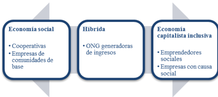
Figura 2. Enfoques del emprendimiento social según el paradigma económico en que se encuentran

En el interés de lograr una mejor clarificación del concepto de emprendimiento social se aprecian tres enfoques de pensamiento en la conceptualización de los emprendimientos sociales: economía solidaria, ingreso por actividad productiva, e innovación social (Defourny y Nyssens, 2008). Estos tres enfoques pueden verse como un continuo en términos del paradigma económico sobre el cual se sustentan, y oscila desde la economía social hasta llegar a la innovación social que se encuentra en un paradigma de economía capitalista inclusiva (van Kemenade y Favreau, 2001) (Figura 2).