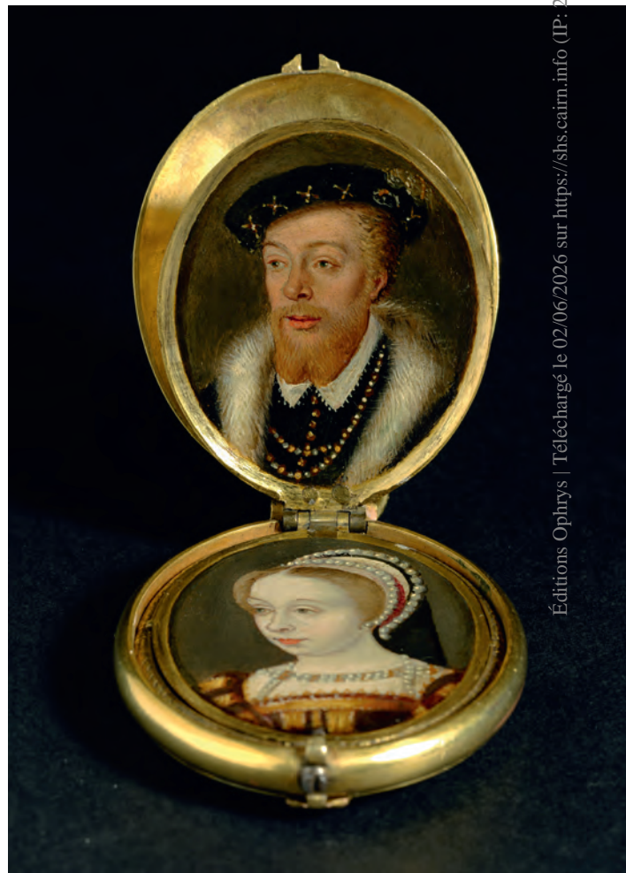
2. Anonyme français, Robert de La Marck, duc de Bouillon, et Françoise de Brézé, son épouse , huile sur cuivre, coll. part.

celuy de la reyne de Navarre d'aujourd'huy, qui le représente vestu tout de blanc 10 ». Même chose chez le cosmographe André Thevet, qui aime à préciser l'origine des portraits reproduits dans ses Hommes illustres . Bien des images lui viennent en effet des cabinets des Grands, tels les portraits de François et de Ferdinand de Gonzague tirés du cabinet du duc de Nevers, celui d'Alphonse I er d'Este issu « du cabinet de Monseigneur de Nemours 11 », ou la médaille de saint Sidoine Apollinaire extraite « du cabinet du conseiller du Prat, en bronze, sentant fort antique ». Et Thevet de noter fièrement que son portrait « au vif » de Louis, comte de Vaudémont, est « semblable à celui que monsieur le Duc de Lorraine, m'ayant mandé pour le veoir et celui de Godefroy de Buillon, m'a assuré estre le sien qu'il a en son cabinet 12 ».