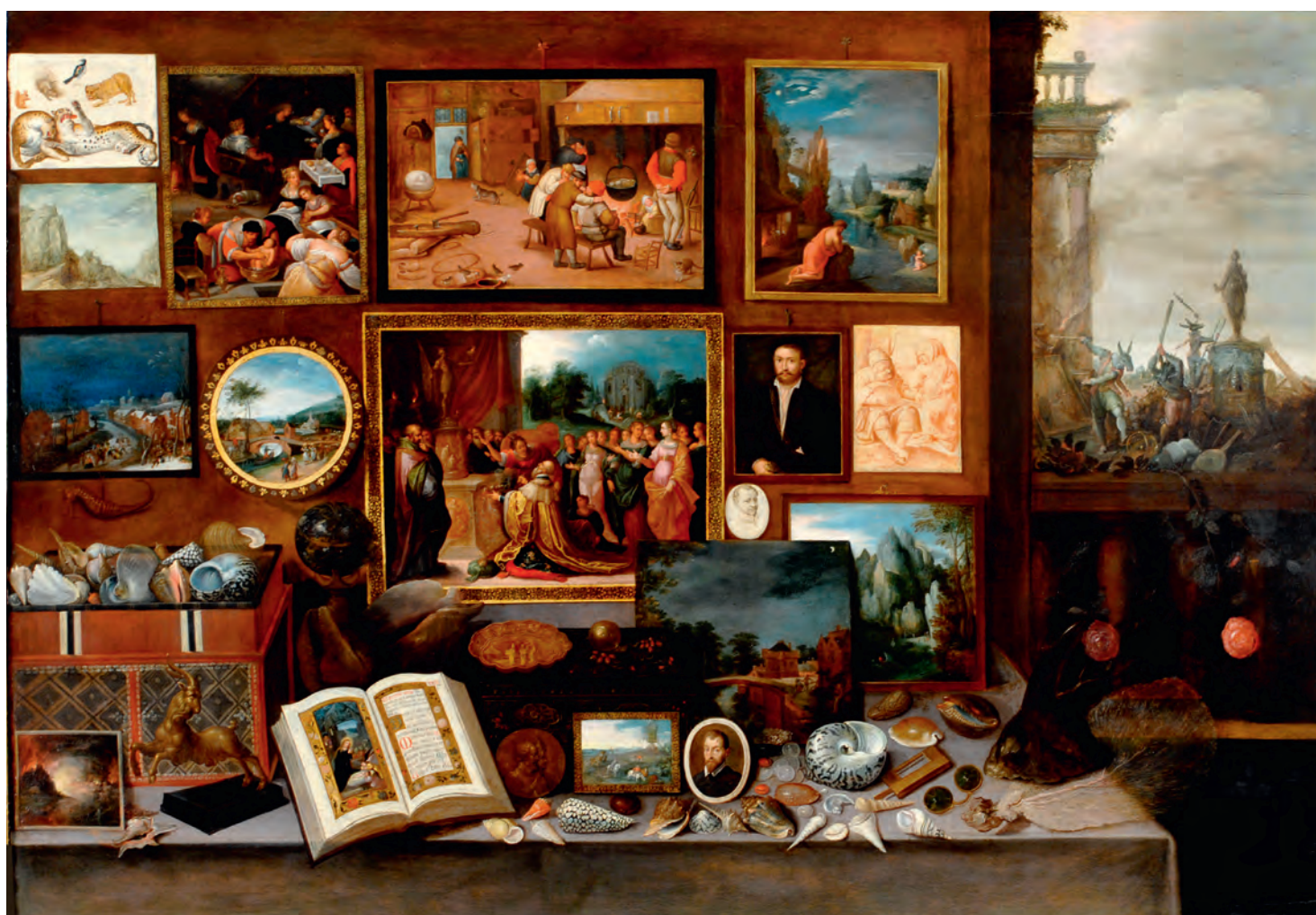
8. Frans II Francken, Cabinet d'amateur avec des ânes iconoclastes , huile sur bois, Chiavari, Museo di Palazzo Ravašchieri, Società Economica.