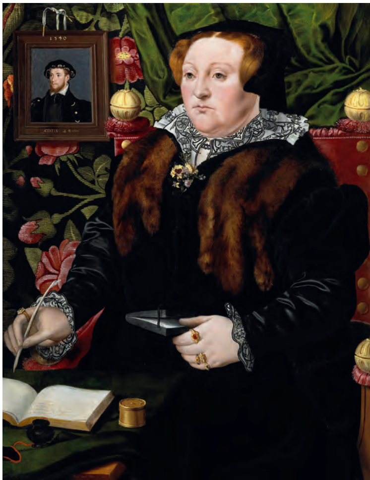
9. Hans Eworth, Mary Neville, lady Dacre , huile sur bois, Ottawa, Musée des beaux-arts du Canada, inv. 3337.