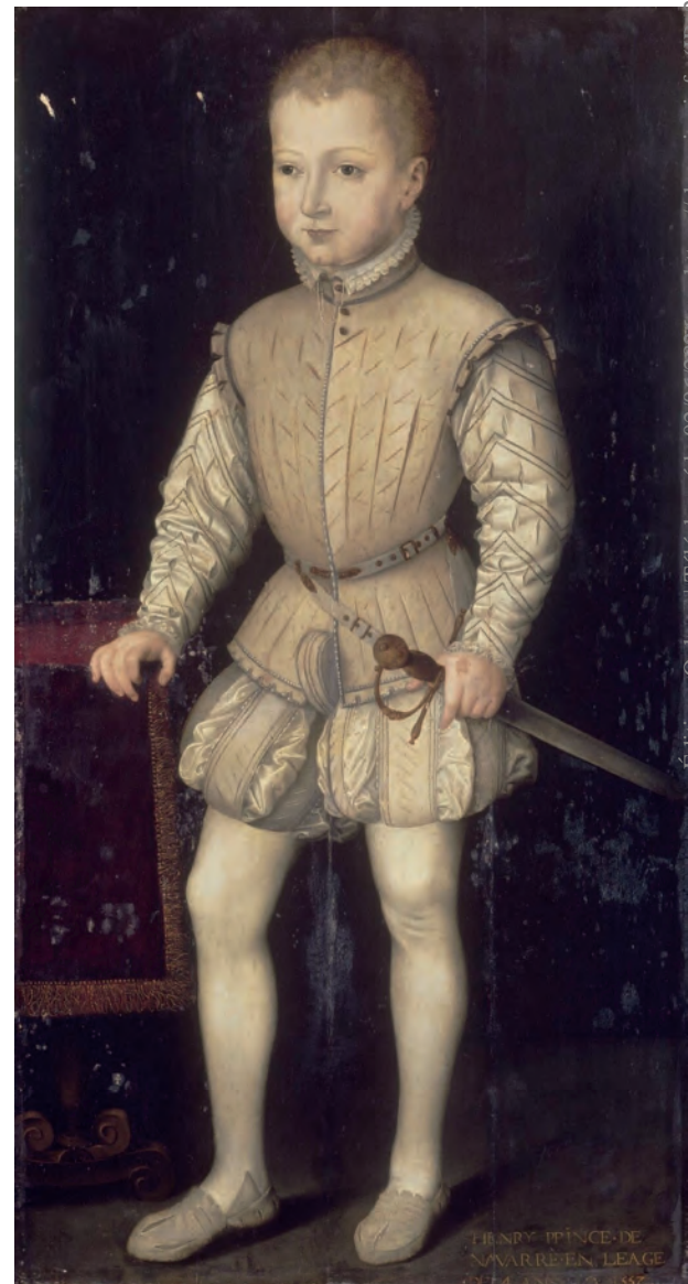
13. Anonyme français, Henri IV âgé de quatre ans, huile sur bois, Versailles, inv. MV 3282.

la rue du Four avec l'effigie de la reine mère sur la cheminée et plus de quarante portraits « de la maison de Médicis que autres maisons », la plupart « avec leurs chassiss », dont « ung tableau de trois pieds et demy de hault du portraict du roy de Navarre en l'age de quatre ans ». Sans doute pourvu d'une annotation qui avait permis la description aussi précise, ce portrait pourrait être celui conservé aujourd'hui à Versailles 42 (fig. 13).