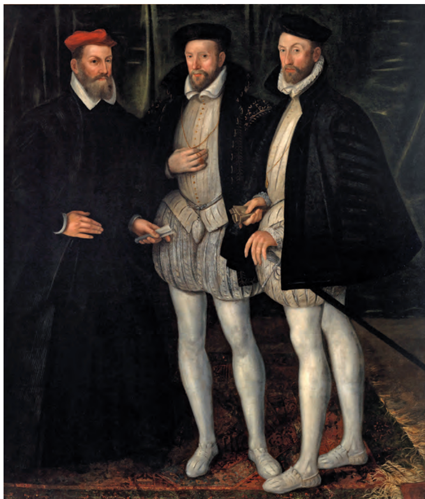
1. Anonyme français, Gaspard, Odet et François de Coligny , huile sur toile. Delft, Museum Het Prinsenhof (dépôt de Mauritshuis, inv. 432).