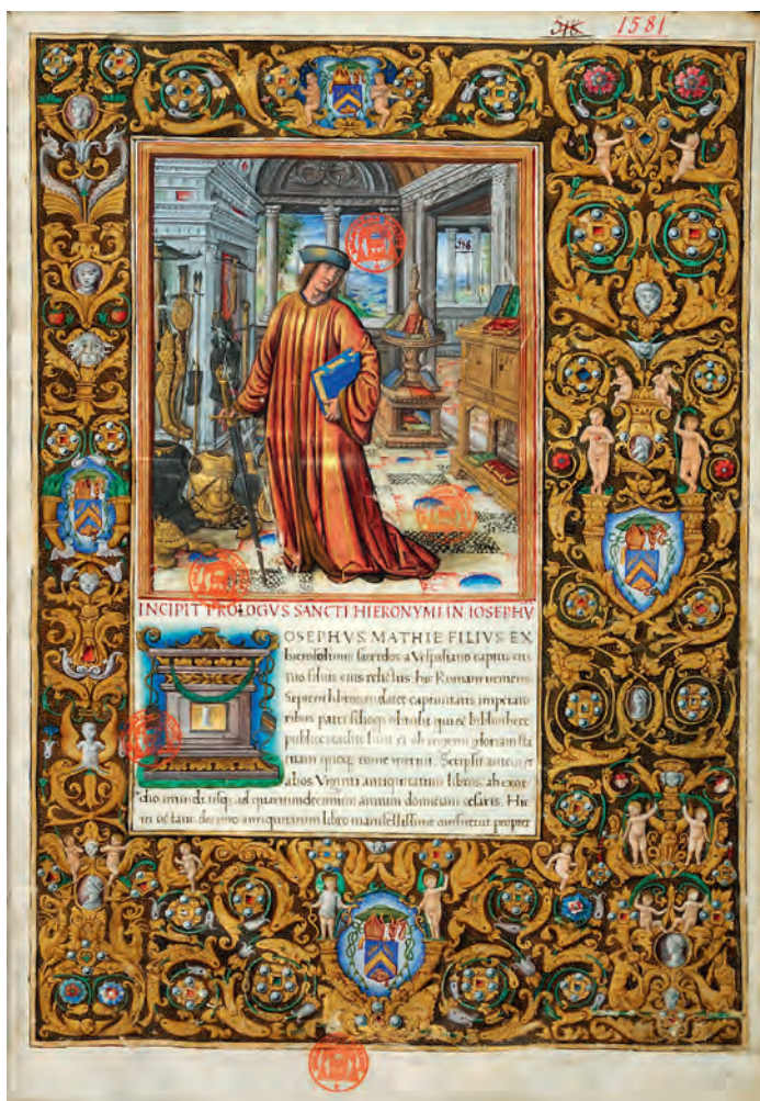
4. Jean Pichore, Flavius Josèphe dans son cabinet . F. Josèphe, Antiquitates Judaicae , Paris, Bibliothèque Mazarine, Ms. 1581, f° 1.

C'est aussi dans la chambre que se trouve le narrateur de Histoire d'amour sans paroles , livre d'images du tout début du XVI e siècle relatant l'amour d'un gentilhomme et d'une dame de qualité 26 (fig. 5). Coiffé d'une barrette et vêtu d'une robe noire, le personnage tient un livre ouvert sur