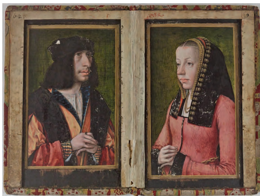
7. Jean Perréal, Portraits en diptyque d'un gentilhomme et de son épouse , tempera sur bois. Paris, BnF Ms lat. 1190.