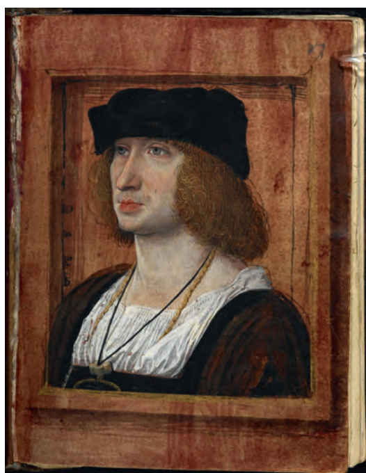
6. Jean Perréal, Pierre Sala . Pierre Sala, Énigmes de l'amour , Londres, British Library, Ms. Stowe 955, f° 17 r°.