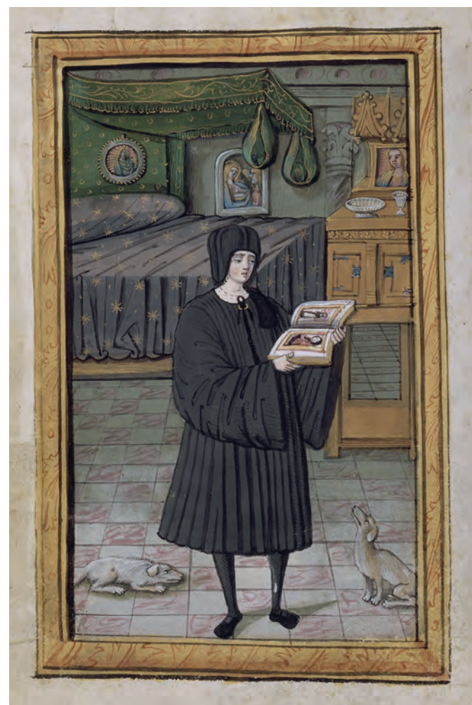
5. École de Tours, L'Auteur dans la chambre . Histoire d'amour sans paroles , Chantilly, musée Condé, Ms. 388, f° 5 v°.