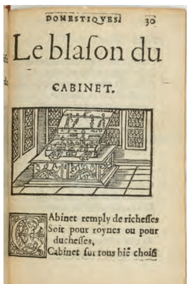
3. G. Corrozet, « Le blason du cabinet », Les blasons domestiques contenantz la decoration d'une maison honneste , Paris, 1539, f° 30 r°.

appartient au XVII e siècle : Thevet, devenu vers 1560 « garde du Cabinet des curiositez du Roy », ne nomme jamais ainsi son propre cabinet rue de Bièvre à Paris, pourtant tout entier dévoué aux « singularitez 21 ».