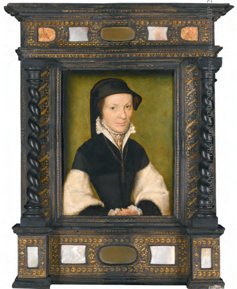
10. Corneille de La Haye dit de Lyon, Portrait d'une veuve , huile sur bois, coll. part.

le portrait en buste de la dame. Cette « image dans l'image » n'est pas sans rappeler un autre portrait exactement contemporain, celui de Pierre Sala peint par Jean Perréal sur la dernière page des Énigmes de l'Amour composées par Sala pour son épouse 27 (fig. 6). Traité comme un tableau, avec son cadre en trompe-l'œil, le portrait de Sala est de ces images intimes que l'on s'attend pourtant à trouver dans un cabinet plutôt que dans une chambre, même si la reliure et l'étui en bois heureusement conservé le protégeaient déjà assez des regards indiscrets. Les petits diptyques conjugaux de Perréal, dont deux seulement subsistent – le premier à l'huile, formé de deux panneaux, et le second peint à tempera sur bois feignant un livre enluminé, chaque visage dissimulé sous une tirette –, pouvaient également être facilement soustraits aux yeux d'autrui, puisqu'il suffisait de les fermer 28 (fig. 7). En revanche, à