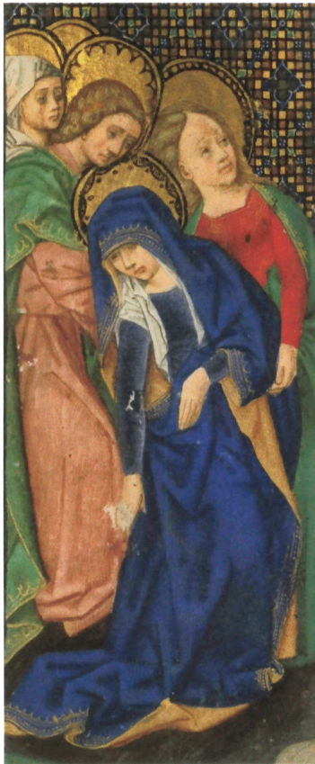
5. Crucifixion peinte par un enlumineur actif à Toulouse, Missel des Minimes , vers 1460-1465, Toulouse, Bibliothèque municipale, Ms 95, f o 154 v o (détail).