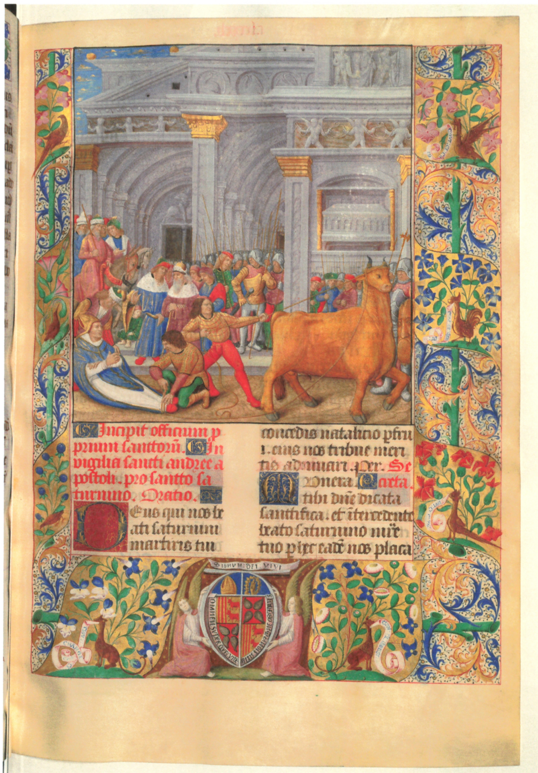
8. Martyre de saint Sernin peint par Liénard de Lachieze, Missel de Jean de Foix , 1492, Paris, Bibliothèque nationale de France, latin 16827, f° 223.

aux vestiges romains réemployés dans les architectures romanes de la région.