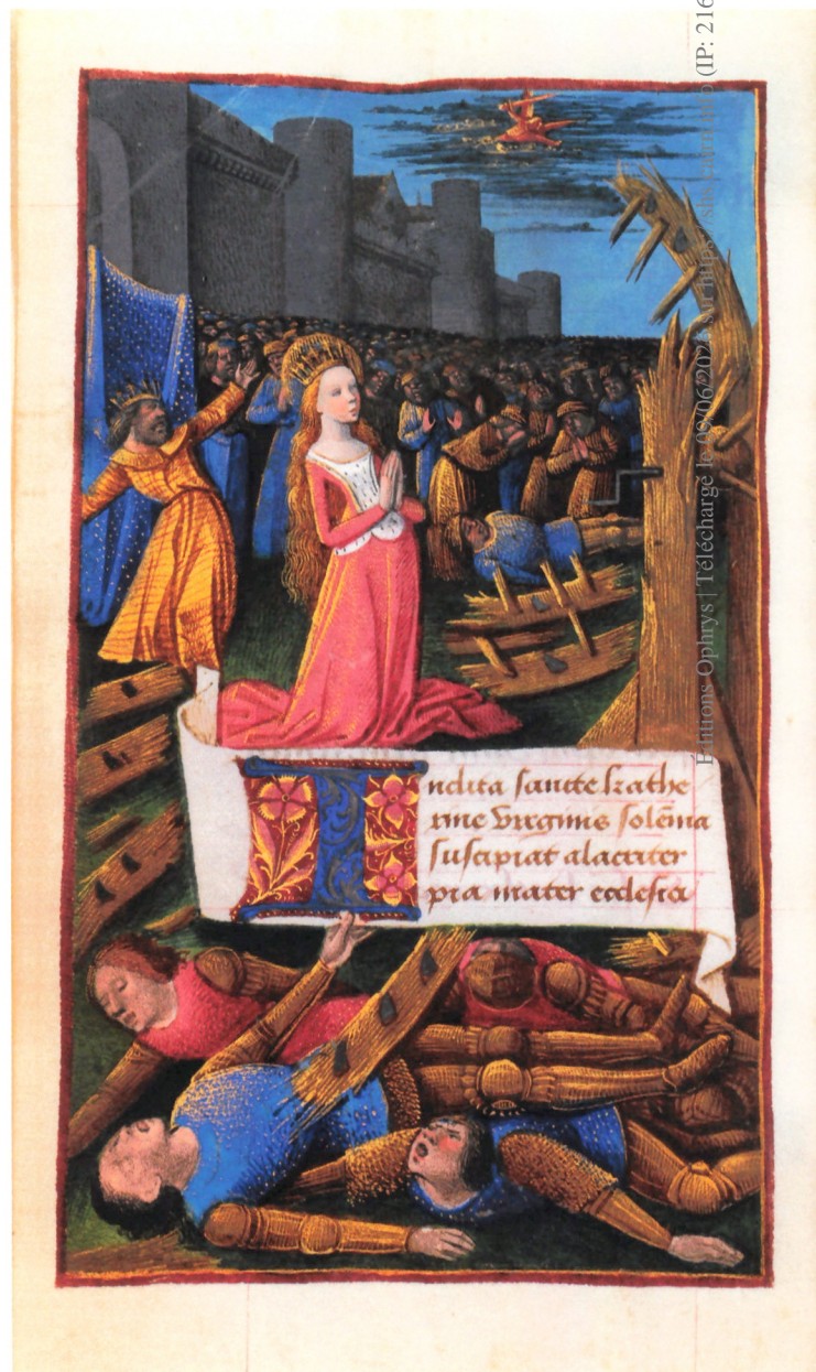
14. Martyre de sainte Catherine peint par Jean Colombe, Heures à l'usage de Rome , vers 1480, collection privée, f° 137 v°.

enlumineur dont la manière s'apparente à celle de Bourdichon, tant dans la galerie ajourée à colonnes que dans le traitement lisse et inexpressif de la Vierge 63 (fig. 15). Cet enlumineur, peut-être formé sur les bords de la Loire, n'était-il pas un de ces artistes de passage dans la cité languedocienne ? Lachieze ne semble pas avoir été séduit par ce répertoire « bourdichonesque », à la différence de son homologue toulousain Laurent Robini, chargé vers 1500 de la décoration peinte d'un livre d'heures 64 . En revanche, l'intervention restreinte de cet historien dans