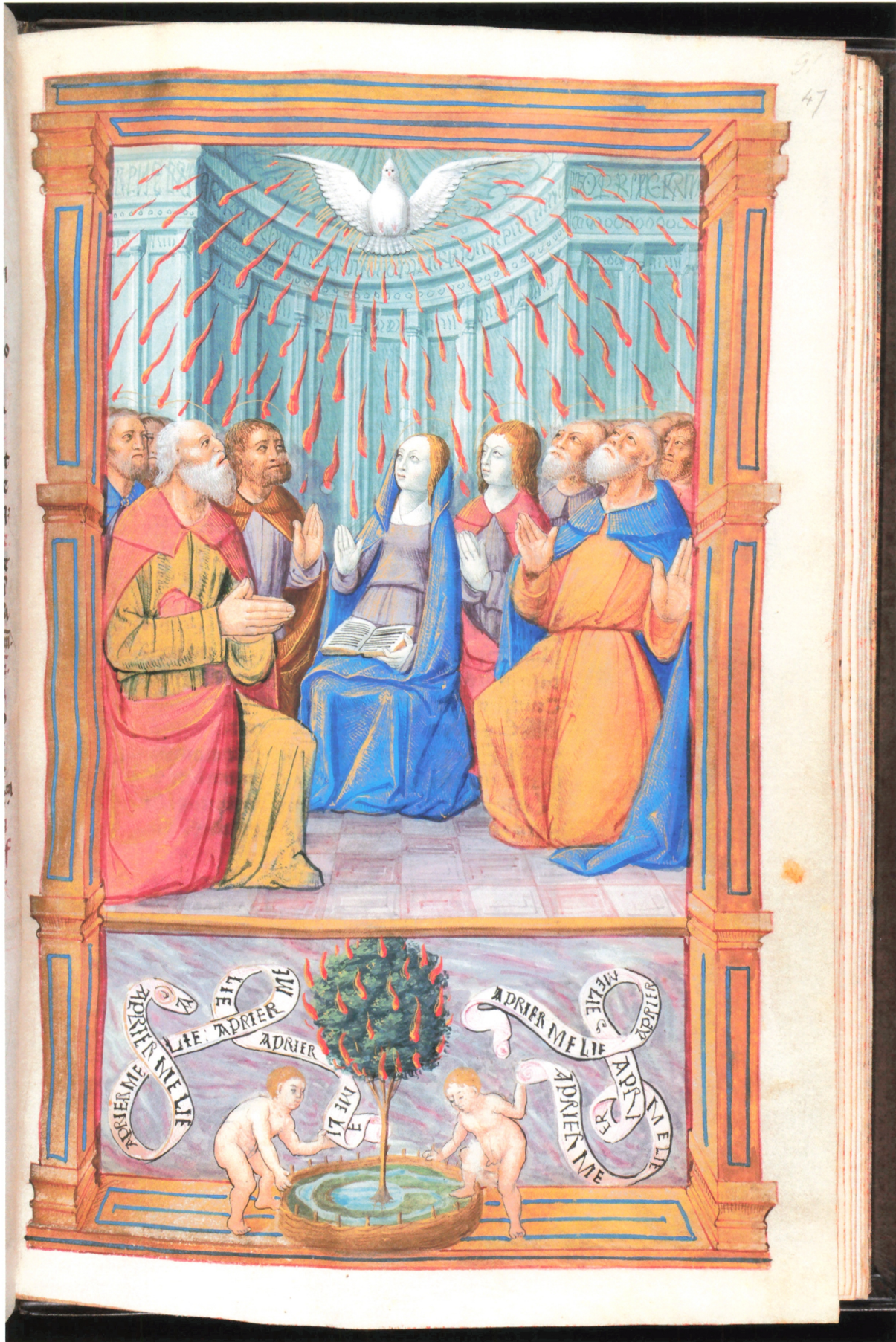
10. Pentecôte peinte par Liénard de Lachieze, Heures à l'usage de Rome , vers 1495, Cambridge, Fitzwilliam Museum, Ms 94, f° 47.