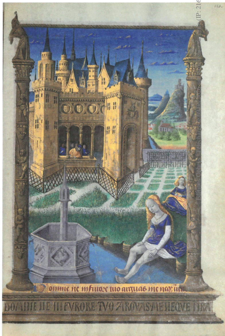
12. Bethsabée au bain peinte par Jean Colombe, Heures de Louis de Laval , vers 1470-1475, Paris, Bibliothèque nationale de France, latin 920, f° 158.