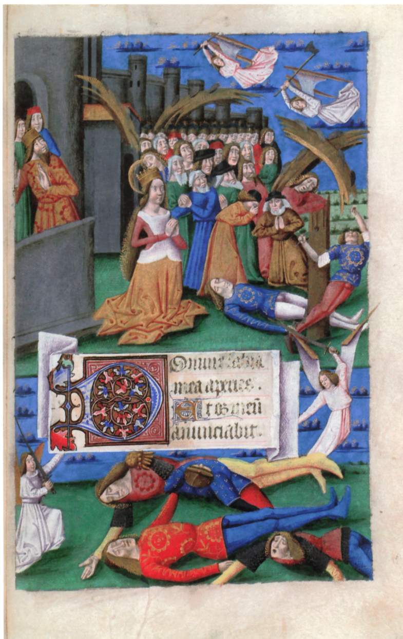
13. Martyre de sainte Catherine peint par un enlumineur actif à Toulouse, Heures à l'usage de Rome , vers 1490, San Marino, Huntington Library, HM 1104, f° 195.