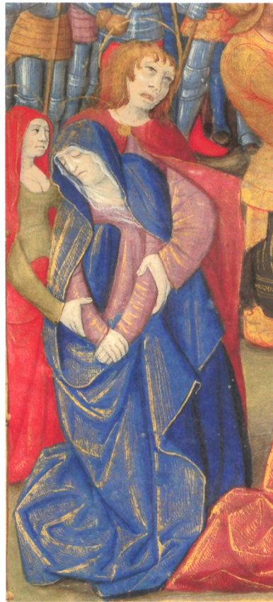
6. Crucifixion peinte par Liénard de Lachieze, Missel de Jean de Foix , 1492, Paris, Bibliothèque nationale de France, latin 16827, f o 136 bis v o (détail).