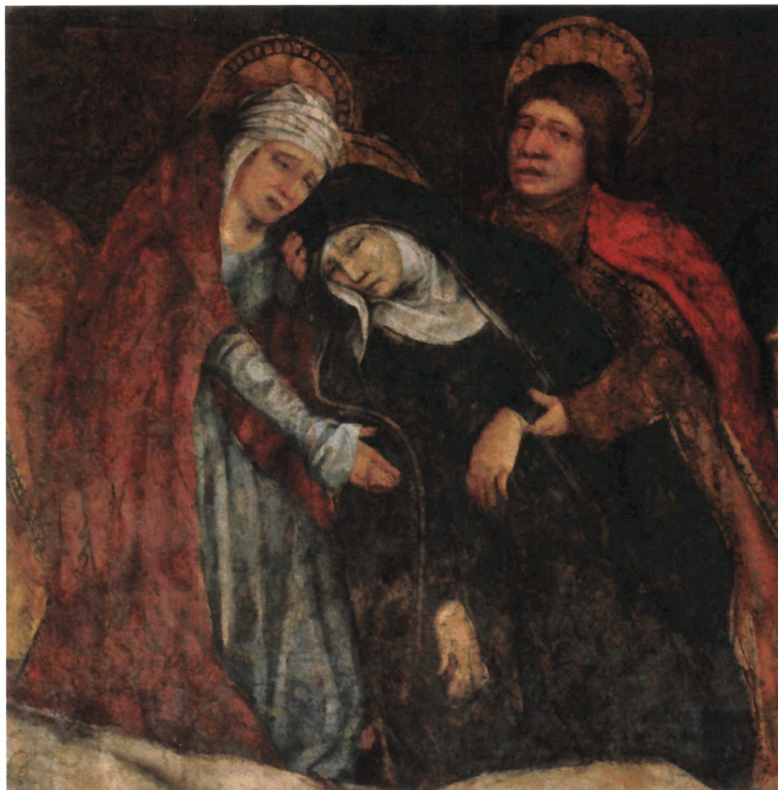
7. Antoine de Lonhy, Mise au tombeau , peinture murale, vers 1462-1465, Saint-Jean-de-Maurienne (Savoie), cathédrale (détail).