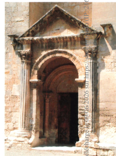
9. Saint-Restitut (Drôme), Portail méridional de l'église Saint-Restitut, XII e siècle.

de forme hybride, associant à l'arc en plein cintre et au tympan historié un entablement à l'antique avec architrave, frise et corniche, peut évoquer un portail d'église du XII e siècle, tel celui de Saint-Restitut en Provence (fig. 9).