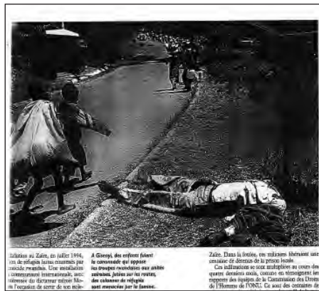
Figure 5 : La mort comme menace : des réfugiés au milieu des morts.

Colombie au Zaïre, en juillet 1996, des réfugiés rwandais fuient la canonnade. Une ressemblance frappante avec les réfugiés rwandais, jetés sur les routes, des colonnes de réfugiés sont menacées par la famine. Zaïre. Dans la droite, un réfugié rwandais est allongé sur le sol, les bras en croix. Ses vêtements sont tachés de sang. Ses yeux sont fermés. Ses mains sont jointes sur son visage. Ses vêtements sont tachés de sang. Ses yeux sont fermés. Ses mains sont jointes sur son visage.