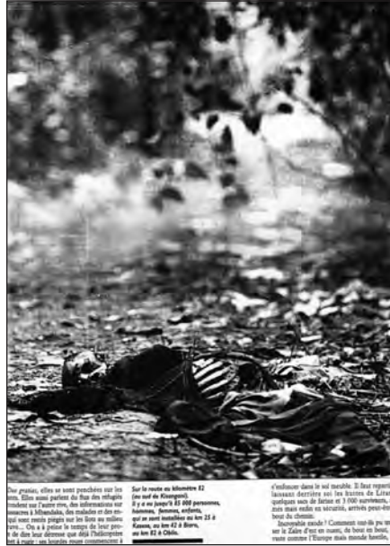
Le Nouvel Observateur (29/05/97, p. 69).

La seconde forme archétypale des représentations de la mort correspond à la mort comme menace pour les réfugiés. Cette thématique est omniprésente lors des conflits des années 90 (Gervereau, 2006) et les conflits des Grands Lacs n'y échappent pas. De manière assez systématique, les réfugiés, et notamment les plus faibles d'entre eux, femmes et enfants, sont présentés comme menacés par une mort incertaine – « la mort en-deçà de la mort » pour Vladimir Jankélévitch (1977) – qui peut revêtir plusieurs formes. Le cas le plus fréquent est la mise en valeur de la précarité de réfugiés dont la mort est encore lointaine, voire hypothétique (première scansion de « l'en-deçà de la mort »). La mort n'est alors présente qu'indirectement sous la forme d'une menace diffuse et sa concrétisation reste sujette à l'interprétation du lecteur. Ce type de cliché très classique (Sontag, 1977) apparaît de manière récurrente mais leur nombre augmente fin mai 1994 avec les clichés des camps de réfugiés de Tanzanie (la menace étant ici les massacres), à la mi-juillet 1994 avec les réfugiés qui fuient vers le Zaïre (la presse souligne les menaces que constituent l'avancée du FPR ainsi que le risque de famine et de maladie) et enfin, entre février et mai 1997, alors que la population rwandaise restée au Zaïre fuit devant l'avancée des troupes de Laurent-Désiré Kabila. Un deuxième temps de « l'en-deçà de la mort » peut aussi être figuré sous la forme d'une mort probable qui se rapproche de plus en