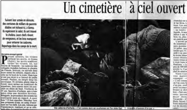
Figure 2 : Une mort de masse imposée au regard du lecteur (fin juillet 1994).

Légende : « Des cadavres d'enfants "c'est comme dans ces cauchemars où l'on reste figé, incapable d'avancer d'un pas" », L'Express (28/07/94, pp. 20-21).