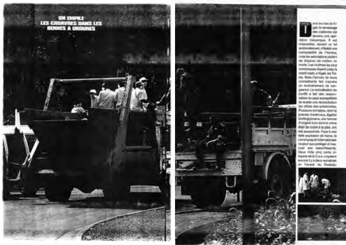
Figure 1 : La présence discrète de la mort de masse au début du génocide.

« Rwanda, la terreur et l'exode », Paris Match , n° 2343 (21/04/94, pp. 60-61).