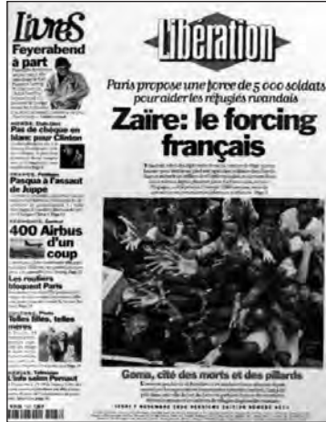
Figure 10 : La mort comme outil de légitimation d'une intervention militaire.

donc pu avoir intérêt à œuvrer dans le sens d'une dramatisation de la situation et d'une focalisation du regard sur les victimes afin de convaincre les opinions françaises et internationales de la légitimité de leur démarche.