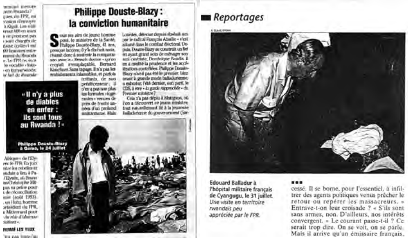
Figure 9 : La communication officielle, vecteur de focalisation du regard sur la mort.