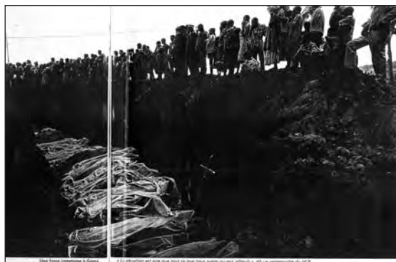
Figure 3 : La mort de masse : les fosses communes de Goma.

Christian Hoche, « Rwanda : l'horreur du monde », L'Express (28/07/94, pp. 18-19). Légende : Une fosse commune à Goma. « La situation est pire que tout ce que nous avons pu voir ailleurs » dit un responsable du HCR 17 .