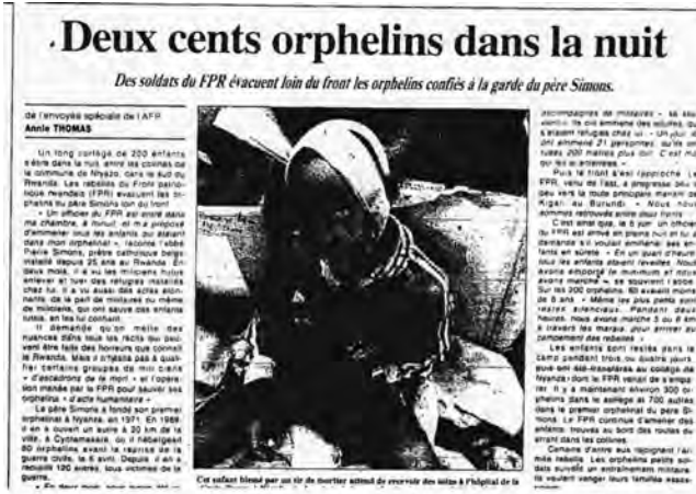
Le Figaro (21/06/94, p. 4).

Au total, deux conclusions principales peuvent être tirées de cette analyse. La première concerne les fortes évolutions tant dans les types de morts représentés que dans les caractères techniques de ces représentations (taille des photographies, cadrage, légende). Si la présence de la mort reste discrète et diffuse y compris en plein génocide ou lors d'affrontements violents entre armées, celle-ci se densifie (nombre, place et taille des photographies) et se diversifie (voir Figure 8) lors de certains moments perçus par la presse comme des temps de crise grave (épidémie de choléra et crise de novembre 1996). Dès lors, le nombre de morts sur le terrain ne paraît plus être le facteur principal expliquant le passage de la mort à la « une » et il apparaît même que certaines réalités ont pu être occultées ou euphémisées (le génocide). Mais l'existence de nombreux angles morts dans les formes de représentation de la mort doit également nous interroger. Comment expliquer l'absence quasi totale de représentations de la mort des militaires et de l'acte de donner la mort (ou de ses tentatives) ? Comment comprendre le peu d'informations apportées par la couverture photographique sur les modes d'extermination, sur l'identité des victimes ou sur les hommages rendus aux morts alors que ces informations sont parfois abordées dans les reportages des envoyés spéciaux. Autant de questions auxquelles l'étude des enjeux des représentations de la mort doit permettre de répondre.