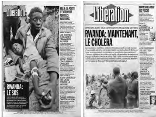
Figure 6 : La mort comme menace : la mort imminente des réfugiés.

À gauche : « Une » de Libération (23/07/94).