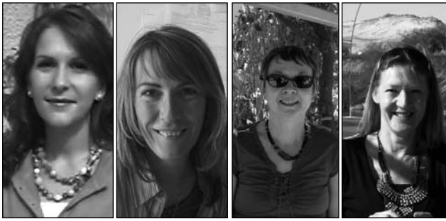
A. Rivet 1