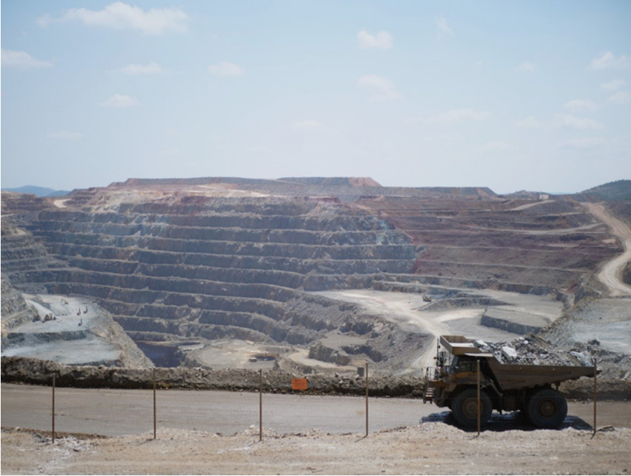
Figure 1. Fosse de la mine de Rio Tinto

Sur le panneau orange accroché au grillage délimitant l'espace de la mine de la route nationale qui la borde, il est écrit « Accès interdit – propriété privée ». © D. Buu-Sao. Août 2022