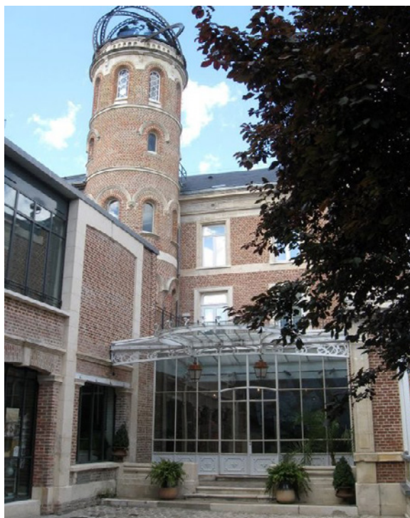
La maison de Jules Verne à Amiens

1905, 24 mars : décès de Jules Verne. Il est enterré au cimetière de la Madeleine à Amiens.