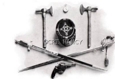
Équipement forestier (début XIX e siècle)

Les administrateurs et les agents forestiers portent tous un habit à revers et pantalon de drap vert, gilet chamois et chapeau français 67 . Enfin, les administrateurs et les agents forestiers de l'Administration générale des Forêts portent une arme.