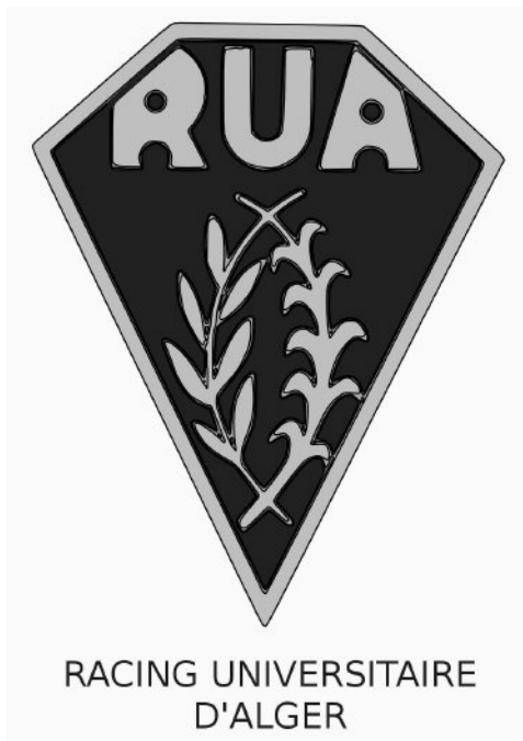
Blason du Racing universitaire d'Alger.

Le déclenchement de l'insurrection algérienne par le Front de libération nationale (FLN) marque le début d'une guerre « sans nom » qui voit la France, pays des droits de l'Homme, se servir de méthodes de « pacification » et de « maintien de l'ordre » rappelant celles de l'occupant allemand employées une dizaine d'années plus tôt. Ceci pour protéger la vie et la propriété des pieds-noirs, fondement démographique d'une Algérie française désormais menacée de disparition. Le général de Gaulle, revenu au pouvoir en 1958 pour résoudre la crise institutionnelle, se sert d'une constitution renfor-