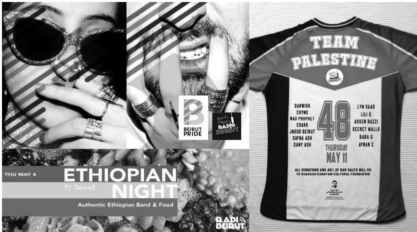
Fig. 4 : Affiches de soirées organisées par Radio Beirut, année 2017

En 2017, Radio Beirut a également hébergé la « Beirut Pride Party », soirée finale de la Beirut Pride : cet évènement nouveau dans la région a consisté en une série de rencontres, de conférences et de projections cinématographiques permettant une plus grande visibilité des mobilisations et de la sphère LGBTQ. Le succès de la nuit de clôture s'est traduit de deux manières : pour l'occasion, une quinzaine de bars à Mar Mikhaïl ont suspendu un drapeau arc-en-ciel sur leur façade, plaçant l'évènement au cœur de l'espace public. Les participants, plus nombreux que la capacité d'accueil du bar – et peut-être encouragés par cette exhibition de signes – ont largement empiété sur les trottoirs et sur la rue, mêlant un usage festif et militant de la canopée nocturne.