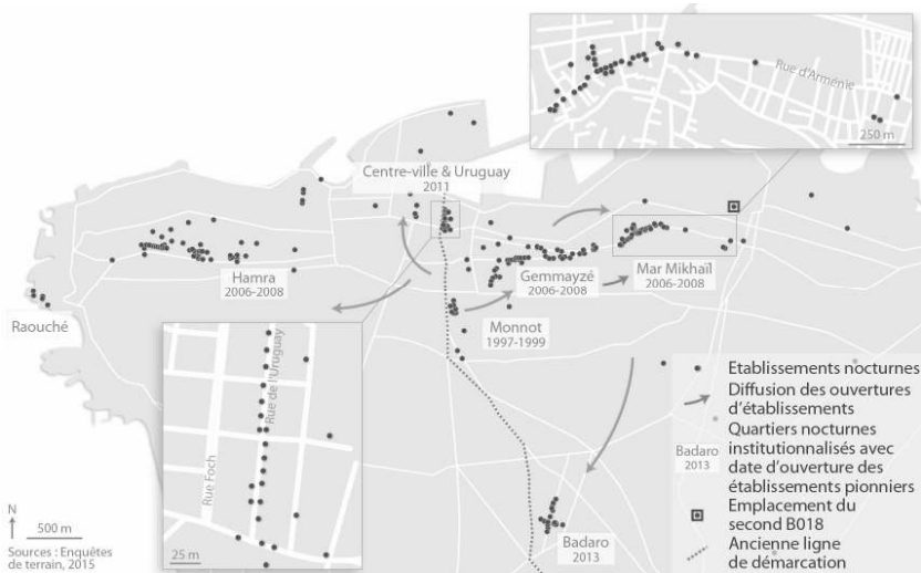
Fig. 2 : Les centralités nocturnes de Beyrouth

Les modalités d'émergence puis de déclin des quartiers nocturnes – dont les cycles de vie sont d'une durée variable – sont comparables d'un quartier à l'autre : ils ne font pas l'objet d'une planification ou d'une politique