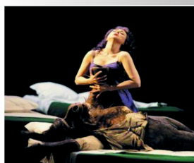
Jean-Michel Vives La Voix sur le divan Musique sacrée, opéra, techno

La voix dans l'Opéra . L'exemple du sacrifice de la voix d'Antonia dans les Contes d'Hoffmann d'Offenbach est utilisé pour donner à entendre ce qui caractérise la voix des sirènes. Antonia vit sous l'emprise d'une terrible maladie lui interdisant de chanter à tout prix alors qu'elle a hérité de la magnifique voix de sa mère, cantatrice décédée. Le Diable