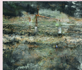
© ANSELM KIEFER, Die Ungeborenen , 2011-2012, 190 x 280 x 20 cm.

Contact : est@carnetpsy.com - Tél : +33 (0)1 46 04 74 35