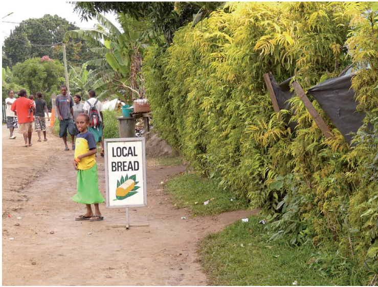
PHOTO 5. – Vente de pain local dans le quartier de Freswota, 2013

l'herbe, réparer les abris, nettoyer des parcelles de terrain, débroussailler, etc.) et par leurs propres initiatives telles que leur coopérative de cannabis et leur station de lavage de voitures. Les dirigeants de l'escouade ont également des relations avec les politiciens locaux et, à l'occasion, le groupe gagne de l'argent en travaillant officiellement pour la municipalité, coupant l'herbe le long des routes principales et travaillant comme gardes de sécurité pour les événements de Port-Vila. Après chaque tâche achevée, Sargent distribue l'argent aux garçons y ayant participé. En outre, il a l'habitude d'offrir le kava le soir même aux membres de l'équipe. Le rôle de Sargent est très proche de celui d'un patron, terme souvent utilisé pour le décrire. Ainsi, nous voyons que c'est l'escouade et non pas la famille qui est devenue le moyen par lequel les jeunes hommes sans emploi surmontent leur incapacité à obtenir un travail, un revenu régulier et leur manque de nourriture.