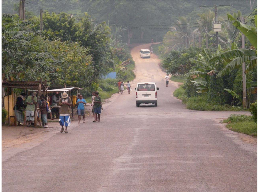
PHOTO 2. – Les parents des jeunes de Freswota croient, qu'en partant vivre en ville, ils assureraient une meilleure vie à leurs enfants ; mais, avec les limites de la scolarisation et le peu d'opportunités pour de réels emplois, beaucoup de jeunes hommes urbains passent leurs journées avec leur escouade sur le bord de la route en s'interrogeant sur le choix fait par leurs parents, 2013

Les parents gagnent la majorité du revenu du ménage. Ils travaillent comme enseignants, employés de bureau, directeurs d'entreprises de construction, propriétaires de petites entreprises ou employés du gouvernement ou d'une ONG. Beaucoup complètent également leurs revenus en louant des petites maisons ou des chambres, en achetant des taxis et des autobus, que les membres de leur famille conduisent en leur nom, ou en gérant des bars à kava ou des petits magasins situés chez eux (voir photo 3 et Rio, ce volume : 96). Ces familles font partie de la classe moyenne urbaine croissante de Port-Vila.