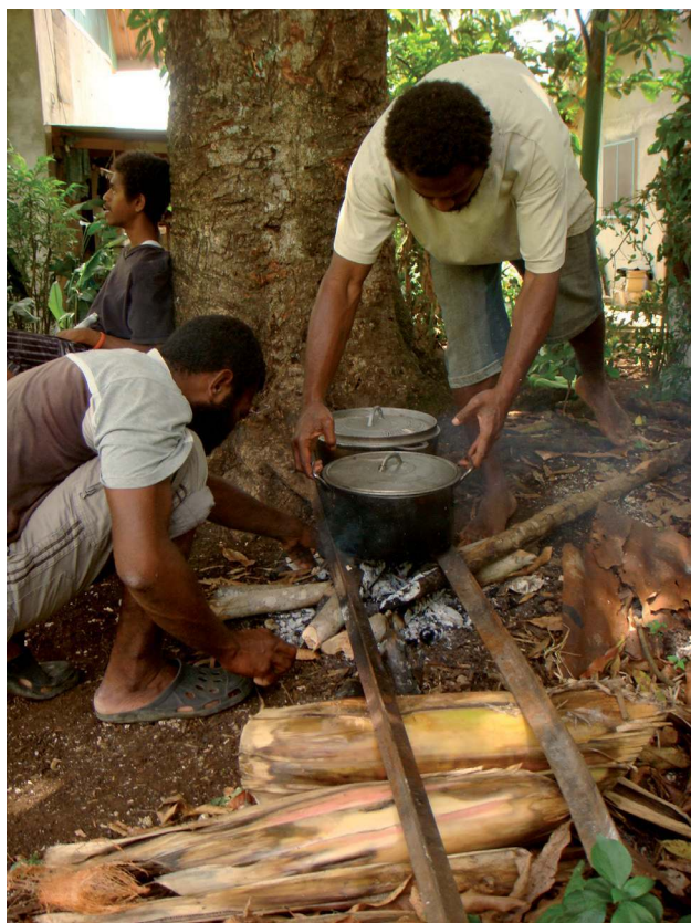
PHOTO 4. – Des garçons de Freswota préparant ensemble le repas pour l'escouade, 2013

façon de moduler les relations sociales (Kahn, 1986 ; Munn, 1986 : 50). À Freswota, la pratique qui consiste à ne pas partager la nourriture avec les fils est de plus en plus répandue. Cela entraîne une transformation des relations familiales en ville. Après la colonisation et l'introduction du christianisme, l'urbanisation devient un moteur de changement social et culturel considérable. Comme Jaksil l'explique :