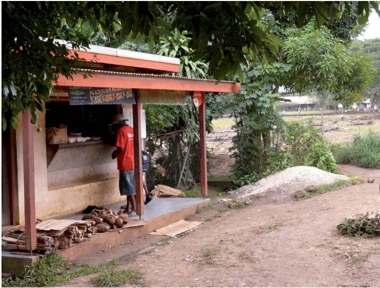
PHOTO 3. – Petit magasin de proximité dans le quartier de Freswota, 2013