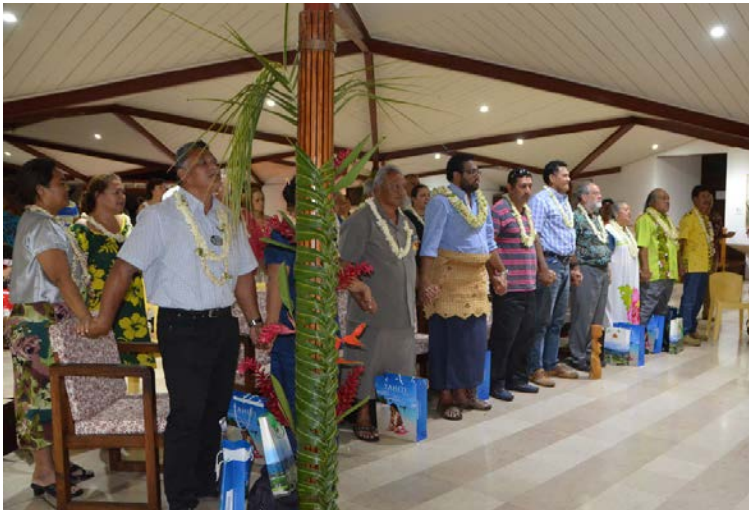
PHOTO 3. – La prière de clôture