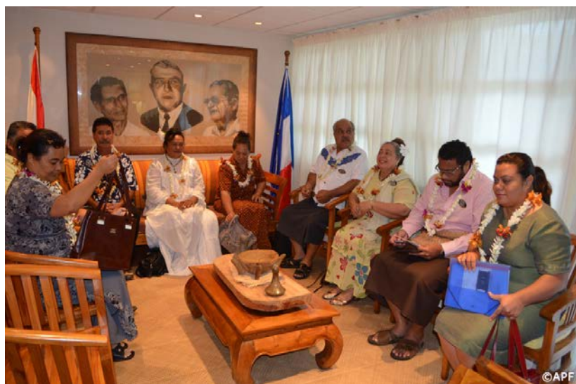
PHOTO 2. – Les délégations parlementaires dans le bureau du président de l'assemblée

« Nous soutenons (les indépendantistes polynésiens)... mais ce processus revient entièrement à eux et au gouvernement français. Nous n'avons pas à nous en mêler. » (Regnault, 2013 : 187)