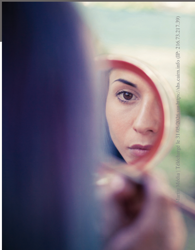
Martin Média | Téléchargé le 31/05/2026 sur https://shs.cairn.info (IP: 216.73.217.39)