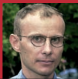
Professeur de psychologie du développement de l'enfant à l'université Paris-Descartes, Sorbonne