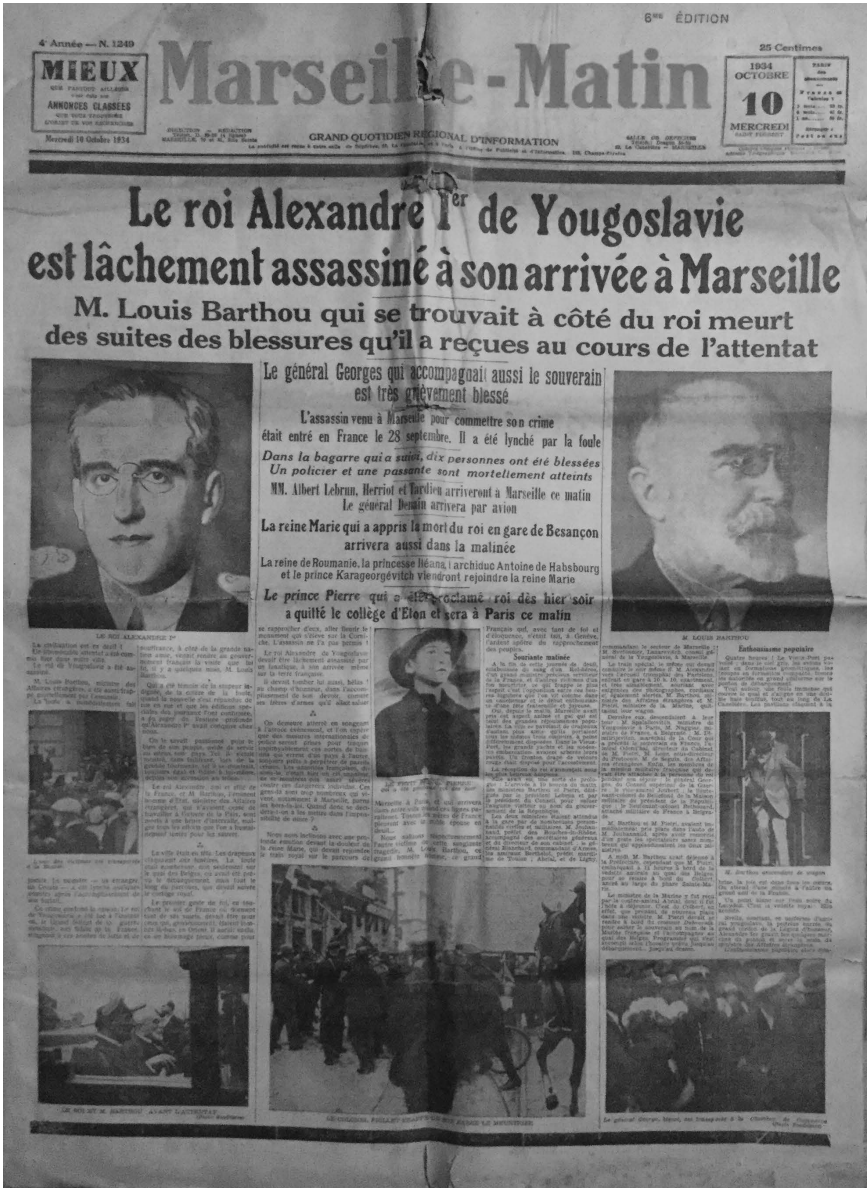
Figure n° 3 : « Une du journal » édition n° 1249, Marseille-Matin, 10 octobre 1934.