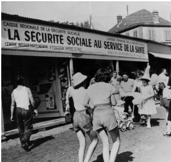
La sécurité sociale pour tous, principe issu du Conseil National de la Résistance.

Ce programme commun, c'était l'espoir de la construction d'un monde nouveau et meilleur. Un programme qui était un véritable pacte conclu entre toutes et tous, qui assurait une véritable cohésion sociale. Et c'est de cela que nos sociétés ont urgemment besoin aujourd'hui. De sentir que, face à l'adversité, on réintroduit de l'égalité et de la solidarité, que l'unité d'un peuple se fait autour de sa citoyenneté. Sinon, on assistera à de grandes ruptures qui se feront dans le sang et dans les larmes, et qui – en plus de son caractère très douloureux – feront perdre beaucoup de temps et d'énergie. Les « choses publiques » méritent plus ; sans grandiloquence exagérée, il faut mettre en place plus de liberté, plus d'égalité et plus de fraternité. Ce n'est pas à proprement parler un problème de camp politique à choisir, mais de pure politique à mettre en place. Une politique pour les citoyens et par les citoyens. En fait, un nouveau pacte social, celui d'établir, garantir et stabiliser la cohésion sociale.