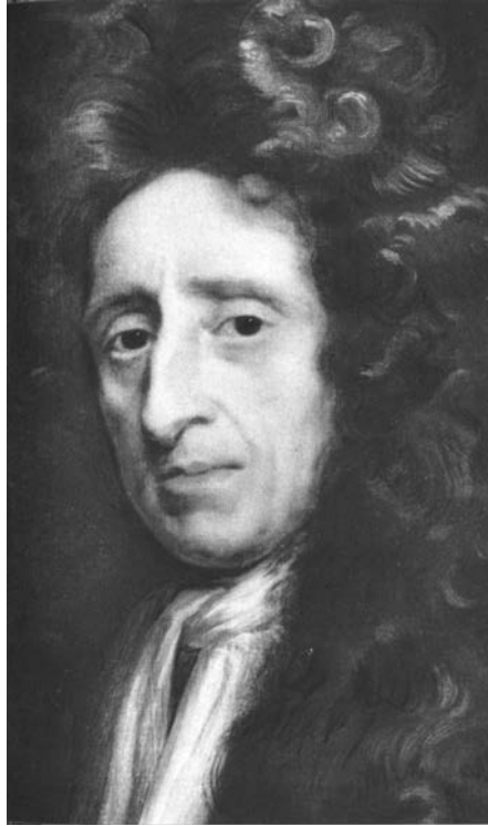
John Locke (1632-1704). Philosophe prônant une Europe rationaliste. Son influence sera considérable sur les philosophes des Lumières.

lien social. Introduit par la Commission européenne en 1980 à propos des fonds structurels puis dans les objectifs de Lisbonne en 2000 du conseil de l'Europe, la cohésion sociale a été dotée d'une stratégie puis d'une direction générale avec comme objectif le lien entre les peuples, la garantie du bien-être pour tous en évitant les disparités, la lutte contre les inégalités et les exclusions, l'équité dans l'accès aux droits, la dignité, l'autonomie. Cela se situe dans le droit fil de ce que Jean-Jacques Rousseau pensait en évitant que les inégalités deviennent trop criantes, pour assurer le bon fonctionnement de la société avec la participation active des citoyens ; c'est aussi une garantie de l'atténuation des éventuels conflits sociaux que l'on trouve chez John Locke, philosophe anglais précurseur des Lumières, un des fondateurs du libéralisme et de la notion de l'État de droit.