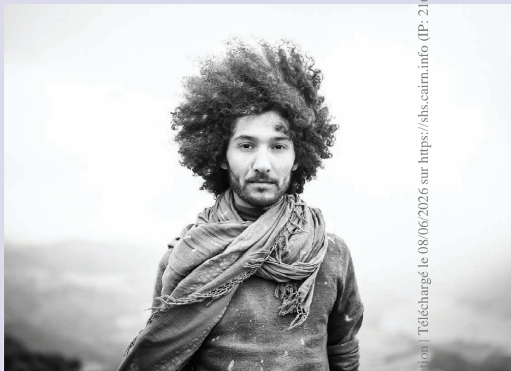
► Walid Ben Selim.