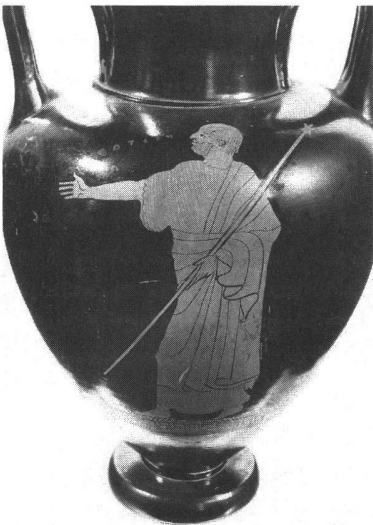
3. Amphore attique à figures rouges, « Nestor » du peintre de Tithonos, Athènes, vers 470 av. J.-C. Musée du Louvre, n° inv. G 213. (Haut. : 30,9 cm - Diam. : 19,2 cm).