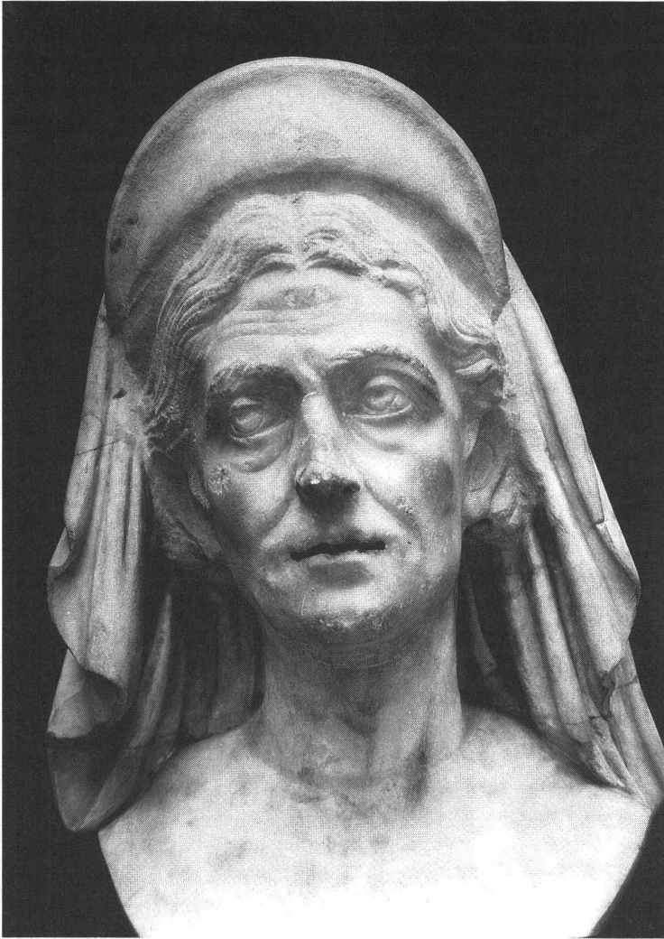
10. Fragment de statue en marbre, Italie, époque romaine impériale, première moitié du III e siècle ap. J.-C. Musée du Louvre. n° inv. MA 995. (Haut. : 38 cm)