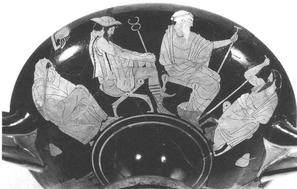
4. Coupe attique à figures rouges, « L'ambassade auprès d'Achille » du peintre de Tarquénia, Athènes, vers 480-470 av. J.-C. Musée du Louvre, n° inv. G 264. (Haut. : 14 cm - Diam. : 32 cm - Larg. : 40,4 cm).