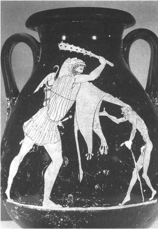
1. Petite attique à figures rouges « Héraclès et Geras » du peintre de Geras. Athènes, vers 480-470 av. J.-C. Musée du Louvre, n° inv. G 234. Haut. : 35 cm - Diam. : 26 cm