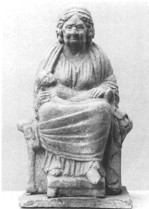
5. Figurine en terre cuite, Tanagra (?) Béotie. « Vieille nourrice », vers 325-300 av. J.-C. Musée du Louvre, n° inv. MNB 1003.