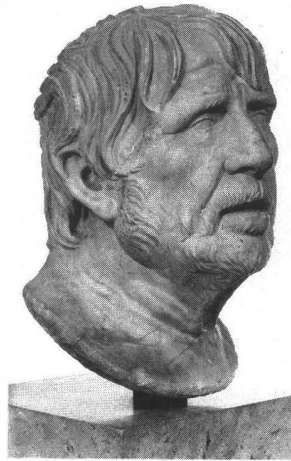
2. Fragment de statue, époque romaine impériale, II e siècle ap. J.-C. d'après un original grec du II e siècle av. J.-C. « Pseudo-Sénèque ». Musée du Louvre, n° inv. MA 921. (Haut. : 32 cm).