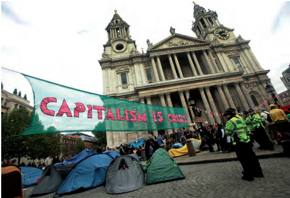
Tentes du mouvement Occupy London Stock Exchange, 16 oct. 2011.