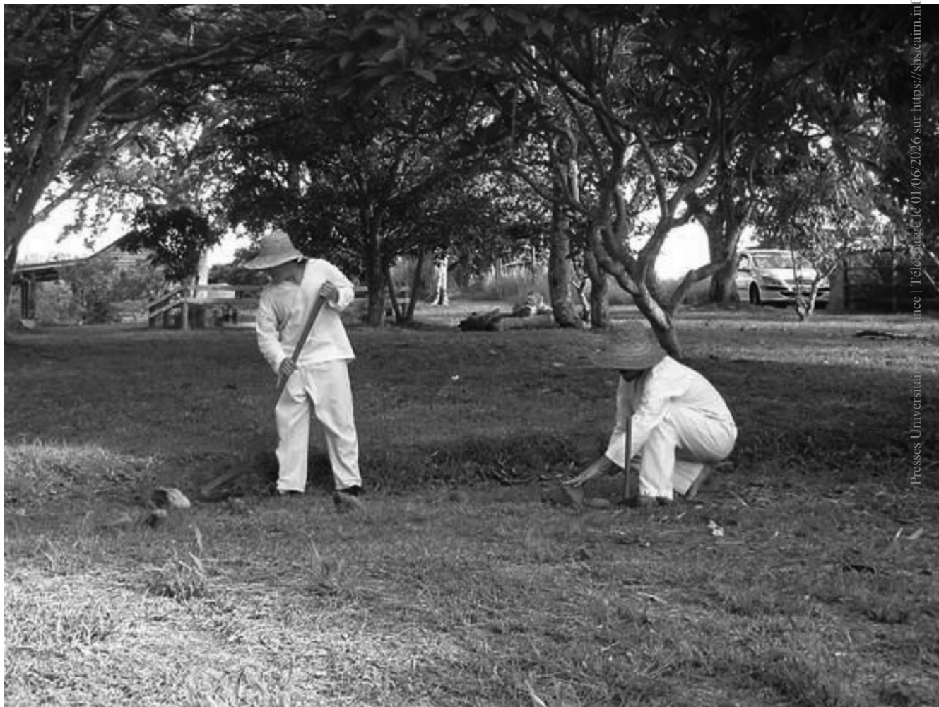
Scène de reconstitution de bagnards mis au service d'une concession agricole. Association « Témoignage d'un passé à la villa-musée de Païta ». Photo de l'auteur, mars 2012.

les années 1960, répond également à cet écart croissant [Terrier, 2004]. Il a été vulgarisé pendant les affrontements de 1984-1985 par la presse métropolitaine en concourant, comme le terme Kanak, à inscrire la bipartition politique dans le vocabulaire ethnique.