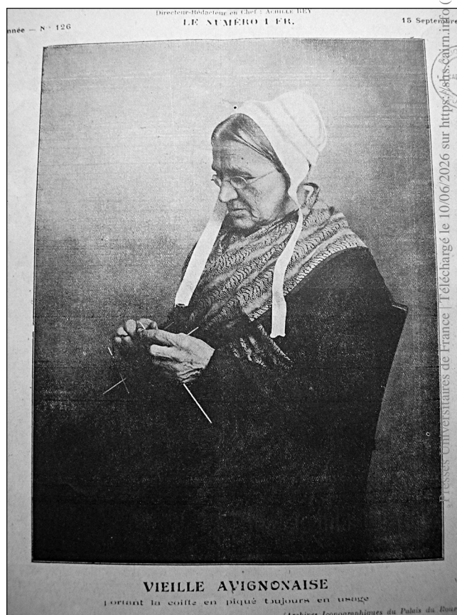
1. Avignonnaise et/en « Comtadine ». Page de couverture des Tablettes d'Avignon et de Provence , n° 126, 1928.

Au-delà cependant de la continuité de problématique, les premières années de guerre en Provence, et plus particulièrement à Avignon, haut lieu félibréen, révèlent le caractère insolite que peut prendre la question vestimentaire dans une conjoncture aussi grave. En concordance assez nette avec d'autres focalisations d'un Félibrige replié sur ses obsessions culturelles, la combinaison de facteurs politiques généraux et de points de vue locaux ne passionnant qu'une poignée de traditionalistes en fait l'objet de querelles publiques dont rien ne subsistera dans l'histoire officielle du « mistralisme » [Jouveau, 1987 ; Berengier, 1994]. Quel est l'« authentique » costume « avignon[n]ais », celui des « Comtadines » ou, selon le terme qui désigne le vêtement de type arlésien à Avignon parmi d'autres localités, celui des « Provençales » ? Voilà pourtant une alternative dont, entre les nouvelles du front et l'évolution des restrictions alimentaires ou vestimentaires, nous entreten