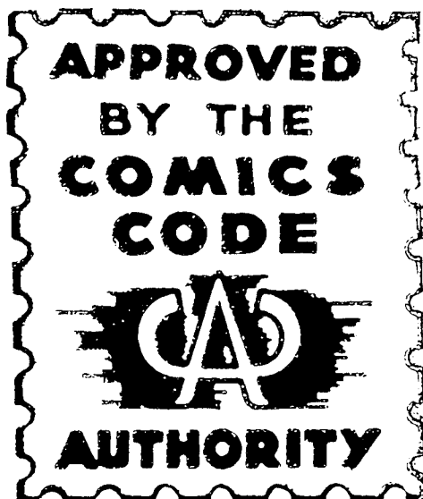
3. Sceau d'approbation de l'Association américaine des magazines de bandes dessinées, fondée en 1954.

À l'école, les problèmes se posent autrement. La décentralisation, qui s'ébauche au XXI e siècle, en France, est le principe dans la fédération américaine : le pouvoir aux États et aux échelons inférieurs, jusqu'à la commune ; les contribuables locaux ou régionaux sont impliqués à tous les niveaux. Donc, pas de programmes, d'examens, ou de diplômes nationaux, seulement des tests créés récemment pour évaluer les compétences, et un test de niveau pour que les universités puissent choisir leurs étudiants ( Standard Aptitude Test ).