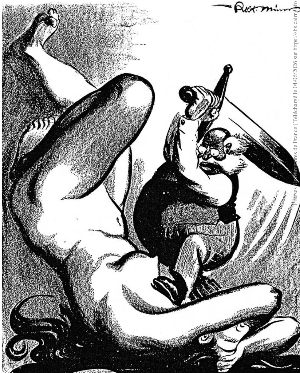
2. « Ô chair immonde ! », A. Comstock vu par Robert Minor ( Masses , 1915).