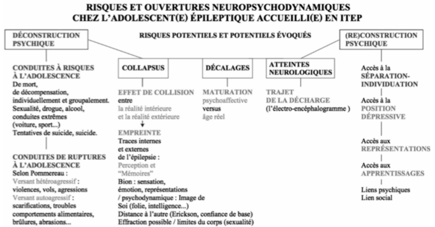
SCHÉMA 2, COLONNE 1 « DÉCONSTRUCTION PSYCHIQUE »

Les questionnements lors de l'admission des jeunes à l'ITEP s'inscrivaient autour de la part des effets potentiellement destructurants des épilepsies, d'effets « zoom », ou masquant des crises épileptiques sur des difficultés pré-existantes. Les risques à l'adolescence se situent autour des conduites d'addictions (drogues, alcool, anorexie...), la déscolarisation, le suicide, la schizophrénie. Dans quel domaine va-t-il exprimer sa souffrance ? Contre lui-même (automutilation, suicide, isolement), contre ses parents, contre la société ? Ou même les trois domaines ? Ainsi, selon la construction de ses objets internes (ses identifications), il lui sera plus ou moins facile de se séparer de sa famille.