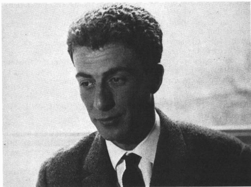
Kateb Yacine en 1967