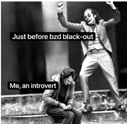
Figure 3. Mème créé par un amateur de drogue. Il reprend l'imagerie du film le Joker pour illustrer la désinhibition qui survient à haute dose de benzodiazépine (« bzd »)

de leurs salons de discussion réservés, ils s'imposent collectivement des normes de discours. De tels choix ne se font évidemment pas sans débat, que nous ne pouvons analyser ici, mais qui mériteraient plus ample discussion. C'est pourquoi les experts tendent à nier le potentiel récréatif 6 des benzodiazépines et à insister sur les risques, espérant ainsi décourager les consommations. Mais lorsqu'une personne consomme quand même, leur RDR consiste à utiliser la messagerie instantanée pour dévier de la logique du black-out : faire prendre conscience à la personne des effets du produit, la convaincre de ne pas en reprendre, et l'encourager à éviter les mises en danger. C'est un cas édifiant d'apprentissage social : les internautes apprennent à reconnaître les effets, et à les apprécier avec mesure.