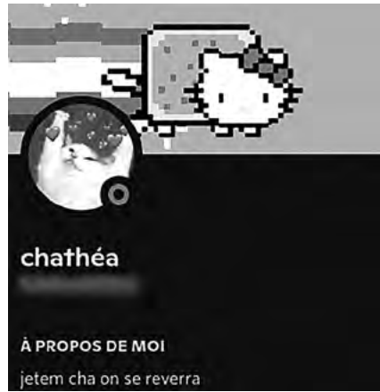
Figure 2. Profil d'un membre du serveur Jaune (09/01/2022)

remarquaient déjà que l'identité collective des collectifs numériques liés aux drogues se manifeste, entre autres, par des hommages aux membres décédés.