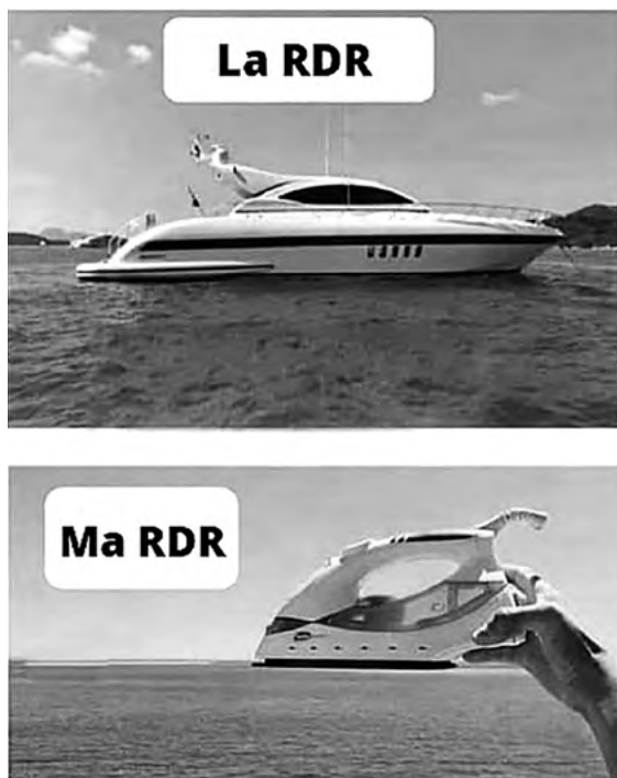
Figure 5. Mème créé par un membre des trois serveurs. Il décrit une dissonance entre l'idéal de RDR et son application

En cela, les statutaires sont comme les autres internautes: ils ne prennent pas toujours de précautions, se mettent parfois en danger et s'en tirent souvent. Cette réalité de l'usage se heurte au «devoir d'image» du parrhésiate de la promesse RDR. C'est pourquoi l'obtention d'un statut entraîne la réduction de l'expression personnelle sur le serveur Bleu. Les statutaires se ménagent des espaces plus intimes où, dégagés leurs responsabilités, ils se permettent une spontanéité qui diverge du modèle RDR.