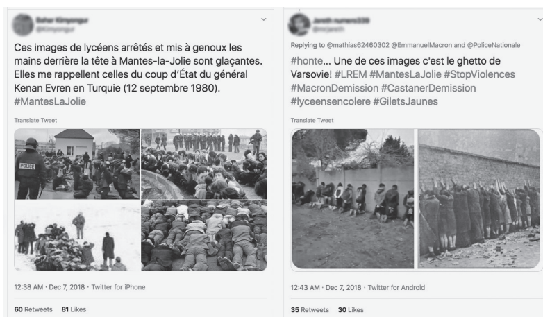
Fig. 8 et 9 – Anonyme, « Images de lycéens arrêtés et mis à genoux », Twitter, 7 décembre 2018 (copie d'écran).