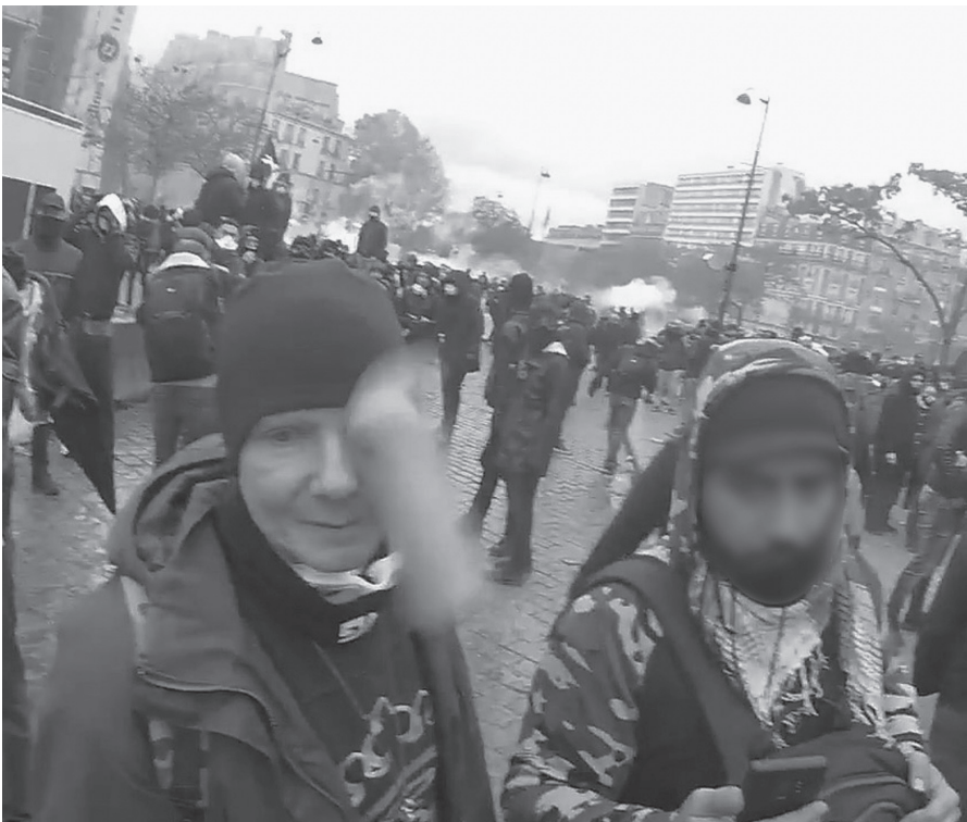
Fig. 12 – Altra, « Image très violente !!! Blessure à l'œil », Twitter, 18 novembre 2019 (photogramme).

Enfin, après les manifestations du 16 novembre 2019, qui marquent le premier anniversaire du mouvement, une vidéo montre pour la première fois l'éborgnement en direct d'un manifestant pacifique, violemment blessé par le jet d'une grenade lacrymogène alors qu'il est filmé en pleine conversation par un street medic , place d'Italie à Paris 28 (fig. 12). Confirmant un an de documents d'une terrible répression, l'enregistrement prouve une fois encore qu'on se trouve en dehors du cadre de la réponse proportionnée. C'est ainsi que, pour la première fois, le 19 novembre, le 13 heures de France 2 et l'édition du soir de BFMTV présentent le blessé non comme un dangereux casseur, mais comme une victime. Le choix de donner la parole aux acteurs et de mettre en avant l'expression de l'émotion humanise la narration et favorise l'empathie du téléspectateur. Outre la rediffusion de la séquence de la place d'Italie, France 2 interviewe Séverine D., la compagne du blessé, en larmes 29 , et BFMTV recueille le témoignage du Gilet jaune sur son lit d'hôpital, allant jusqu'à commenter : « Il n'est pas normal en France de ne pas pouvoir manifester librement et d'être visé sans raison apparente par les forces de l'ordre 30 . »