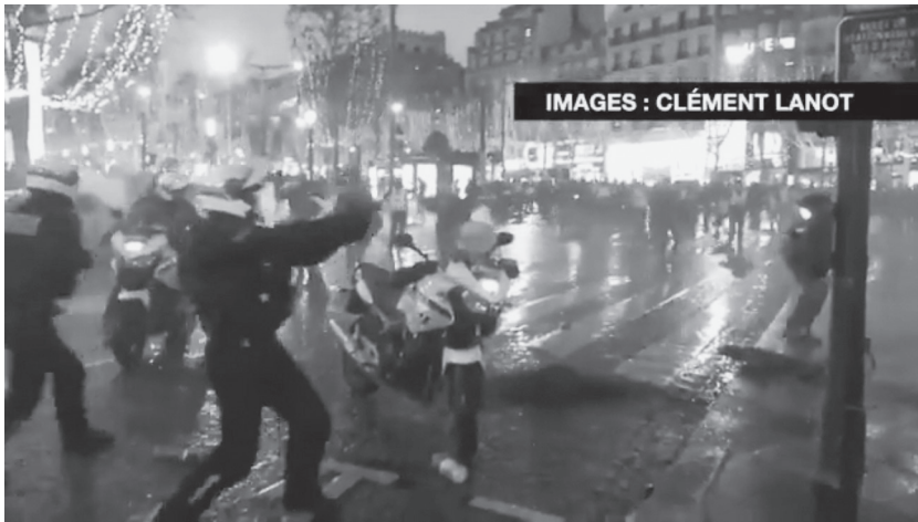
Fig. 10 – Clément Lanot, « Les motards de la police », Twitter, 22 décembre 2018 (photogramme).

manifestation parisienne des Gilets jaunes, au croisement entre les Champs-Élysées et l'avenue George-V. Les chaînes d'information ont diffusé vers 18 heures une scène spectaculaire où les motards essuient des coups et des jets de projectiles puis tentent de repousser leurs assaillants. Mais à 21 h 28, une nouvelle vidéo de 2 min 09 secondes est publiée sur Twitter par le journaliste indépendant Clément Lanot, qui montre la minute précédant l'affrontement, au cours de laquelle on voit les motards projeter plusieurs grenades de désencerclement dans la foule qui défile pacifiquement 23 (fig. 10). D'une grande lisibilité compte tenu de la complexité de l'altercation, le document en dévoile donc la cause, qui apparaît comme une provocation et suscite la condamnation des internautes.