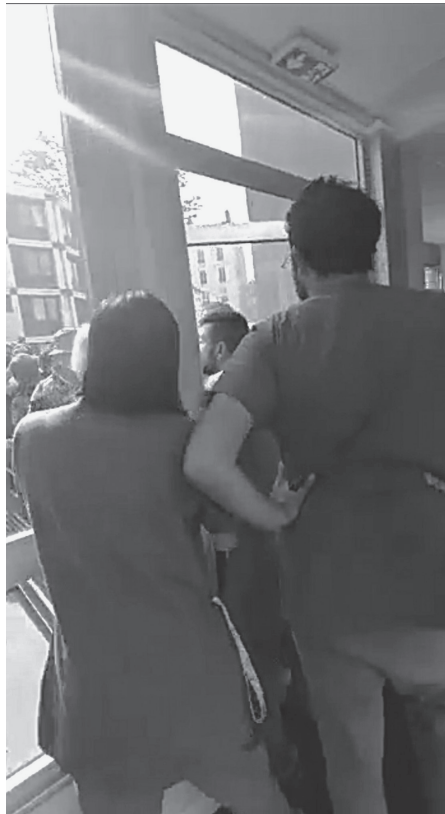
Fig. 11 – Anonyme, « Vidéo Salpêtrière », YouTube, 2 mai 2019 (photogramme).

Confirmée par la direction de l'hôpital et rapidement amplifiée par les médias nationaux, cette description alarmiste est contredite par un enregistrement vidéo diffusé sur Facebook dans l'après-midi du 2 mai 26 (fig. 11). Montrant la fuite de quelques dizaines de Gilets jaunes qui tentent fébrilement d'échapper à l'agression de forces de l'ordre motorisées, cette séquence filmée de l'intérieur par un soignant atteste que les manifestants sont restés à l'extérieur du service, refoulés par le personnel. L'évidence de la preuve impose au ministre de corriger publiquement son propos, dans un rare geste d'autocritique 27 .