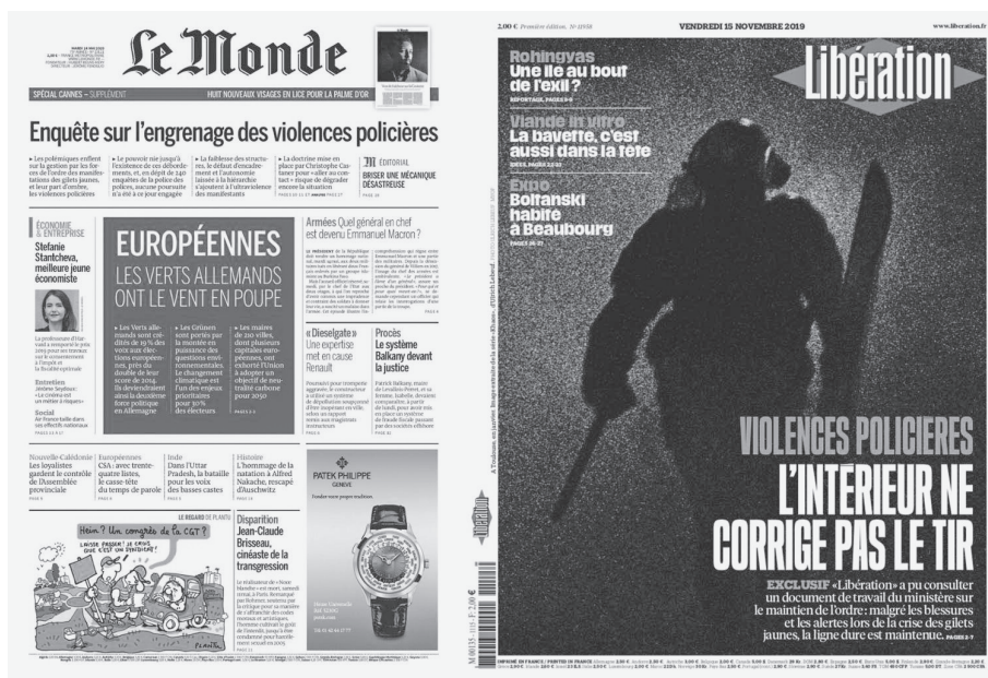
Fig. 1 et 2 – Le Monde , 14 mai 2019, p. 1. Libération , 15 novembre 2019, p. 1.

La mise en exergue de la répression dans la presse ne s'effectuera qu'après la période la plus active du conflit. Le premier, Le Monde , consacre sa manchette de une à la question des violences policières dans son édition du 14 mai 2019, six mois après le début du mouvement des Gilets jaunes 5 (fig. 1). Libération attendra le 15 novembre 2019, pour le numéro anniversaire de la crise 6 (fig. 2). Selon l'éditorialiste Paul Quinio, « l'expression "violences policières", réfutée par Christophe Castaner, s'est imposée comme un vocable phare de l'année mouvementée qui s'achève 7 ».