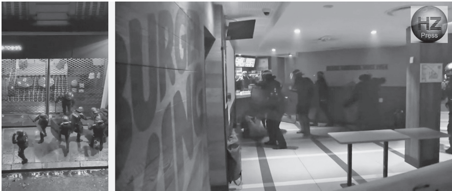
Fig. 5 et 6 – Anonyme, « La police française en plein sang-froid », Twitter, 2 décembre 2018 (photogramme). Hors-Zone Press, « Des Gilets jaunes se font violemment matraquer dans un Burger King », YouTube, 4 décembre 2018 (photogramme).

Les deux premières vidéos virales de violences policières, filmées au soir du 1 er décembre 2018 à Paris, suscitent une vive émotion, mais ne sont pas immédiatement identifiées comme les documents d'un nouveau paradigme. Diffusée le lendemain sur Twitter, l'une montre une brève interpellation rue de Berri, enregistrée au smartphone par un témoin, de sa fenêtre à l'étage 16 . En contrebas, de l'autre côté de la rue, on aperçoit un individu brutalement arrêté et jeté au sol par trois policiers, rapidement rejoints par d'autres, qui le frappent à coups de pied et à coups de matraque, sous les cris de protestation des témoins (fig. 5). D'une durée de 21 secondes, la vidéo ne dévoile aucun élément de contexte expliquant la violence de l'intervention.