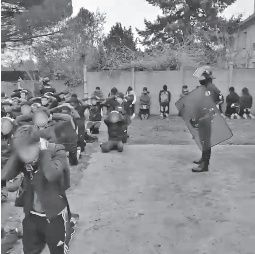
Fig. 7 – Violences policières, « Images de l'interpellation de dizaines de lycéens à Mantes-la-Jolie », Twitter, 6 décembre 2019 (photogramme).

Ces arguments imposent de dépasser la simple expression de l'indignation. On voit alors des internautes chercher des situations comparables, ou associer les images de la vidéo à d'autres exemples d'humiliations collectives : prisonniers de guerre, ghetto de Varsovie, coup d'État turc de 1980, exécutions par les groupes djihadistes, etc. (fig. 8-9). Cette forme de lecture symbolique, rarement appliquée au document vidéo, indique que les participants au débat ne prennent pas seulement connaissance de l'information visuelle, mais simultanément des appréciations qui l'accompagnent, et qui contribuent à orienter leur jugement. Une internaute l'exprime clairement : « Ce soir, je vois les vidéos de Mantes-la-Jolie. Stupeur. Cette vidéo de lycéens, à genoux, en rangs, les mains sur la tête pour certains, attachés pour d'autres, me glace. [...] Puis je lis les commentaires, un peu partout, en réaction à cette vidéo. Beaucoup d'indignation devant ces attitudes inhumaines. Et aussi, aussi... Tous ces autres commentaires, haineux 21 . »