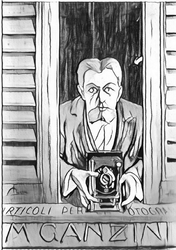
Figure 5 : d'après Mazza, M. Canzini, Aldo, 1912