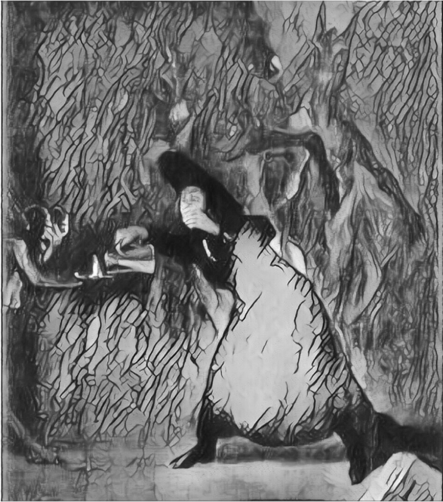
Figure 2 : d'après L'Enfermé ou La Lampe du Diable , Goya

Iconographiquement, nous sommes en présence d'un lieu commun fantas(ma)tique dont Ellen, par télépathie, et nous, par empathie pour elle, sommes les « actualiseurs ». On songe, encore, en écrivant ces lignes, au tableau de Goya L'Enfermé autrement appelé La Lampe du Diable (figure 2), où l'Espagnol instaure, de manière démonstrative, ce topos transmis d'âge en âge : le monstre en tant qu'être « surgi » et suscité. L'artiste a brossé, pas tout à fait sorti de la coulisse, un « bouc-femelle » (il a des seins !) dont le lumignon est approvisionné en huile par un prêtre effrayé par son propre geste. Ce bouc, vu de profil, convoqué dans l'espace de qui en a voulu magiquement l'arrivée, c'est déjà Nosferatu ; qu'il s'agisse de l'espace du rêve (l'image est alors reçue comme subjective) ou de l'espace « réel » où se tient l'inférieure créature (et parfois la victime pétrifiée). Afin d'établir au mieux le climat fantastique de sa composition, Goya – qui ne dispose que d'un support