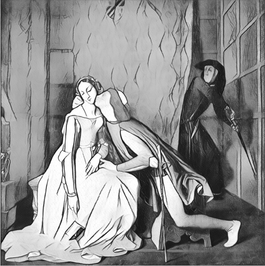
Figure 7 : d'après Paolo et Francesca, Ingres, 1819

laquelle se tient le passeur d'ombres est l'équivalent du boîtier de l'appareil que protègent les volets qui, écartés d'une pichenette, métaphorisent l'obturateur.