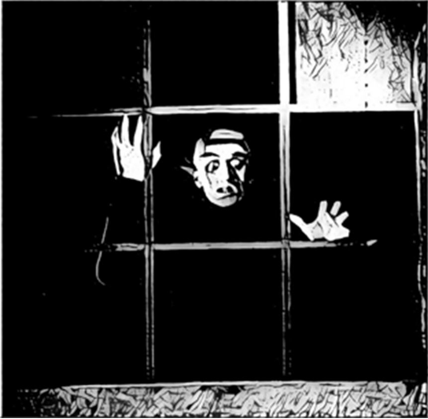
Figure 1 : d'après Nosferatu , Murnau, 1922

un bâtiment vétuste, dont les vitres ont disparu, (voir figure 1). Depuis sa position élevée, le comte lorgne sur Ellen qui, de l'autre côté de la place, dort dans sa chambre où elle a, imprudemment, laissé ouverts les rideaux.