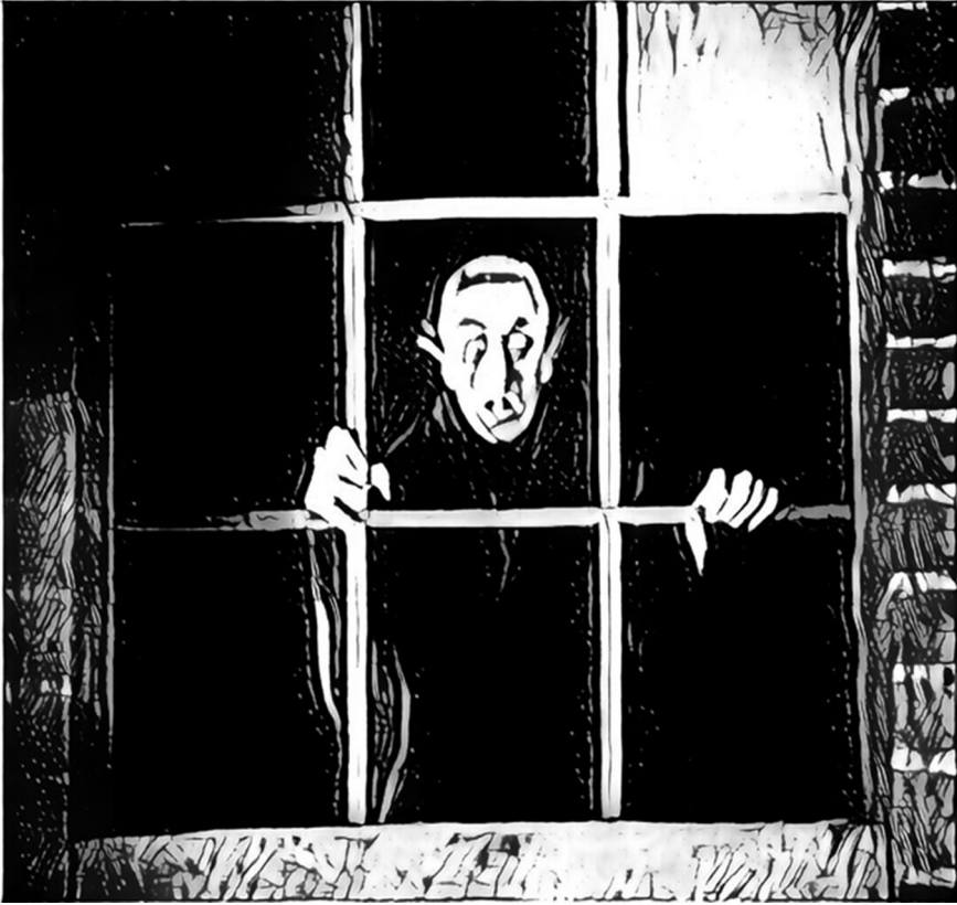
Figure 4 : d'après Nosferatu , Murnau, 1922

« fenêtre d'opportunité » que constitue l'écran à ce moment-là du film, le comte, « secrètement familial » 5 , c'est bien Thanatos venu chercher son dû. L'inéluctable règne.