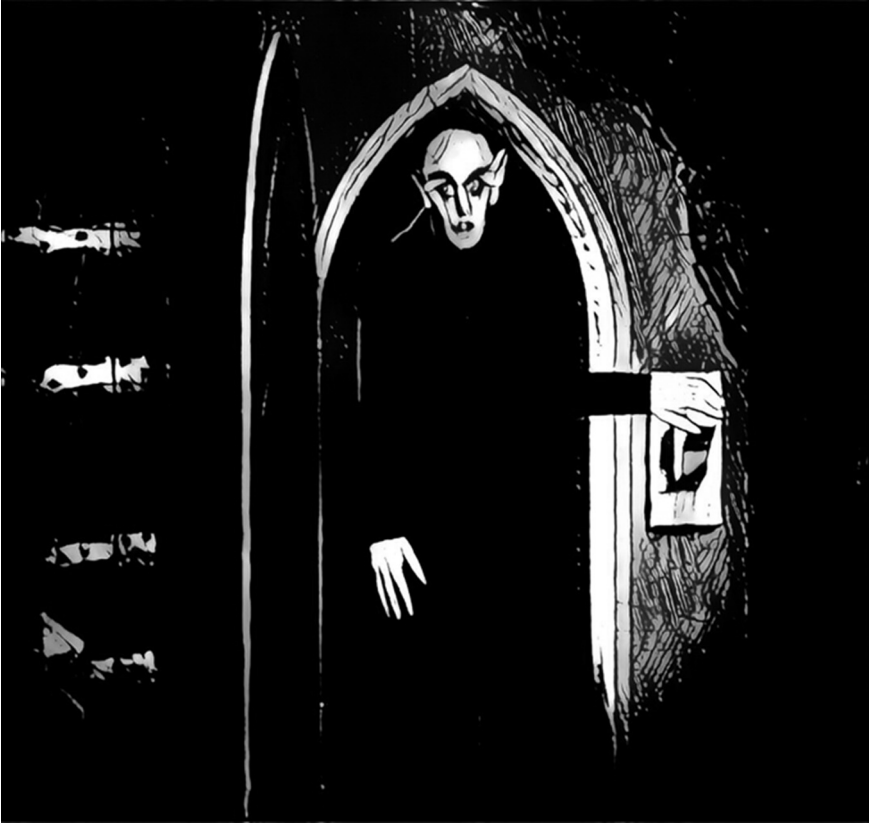
Figure 3 : d'après Nosferatu , Murnau, 1922

fixe unique – a pris soin de peindre derrière le prêtre les figurines « capricieuses » d'un pandémonium. Comme tiré de cet ensemble flou, le bouc arrive au « pays des hommes » précédé de sa lâmpara descomunal 4 .