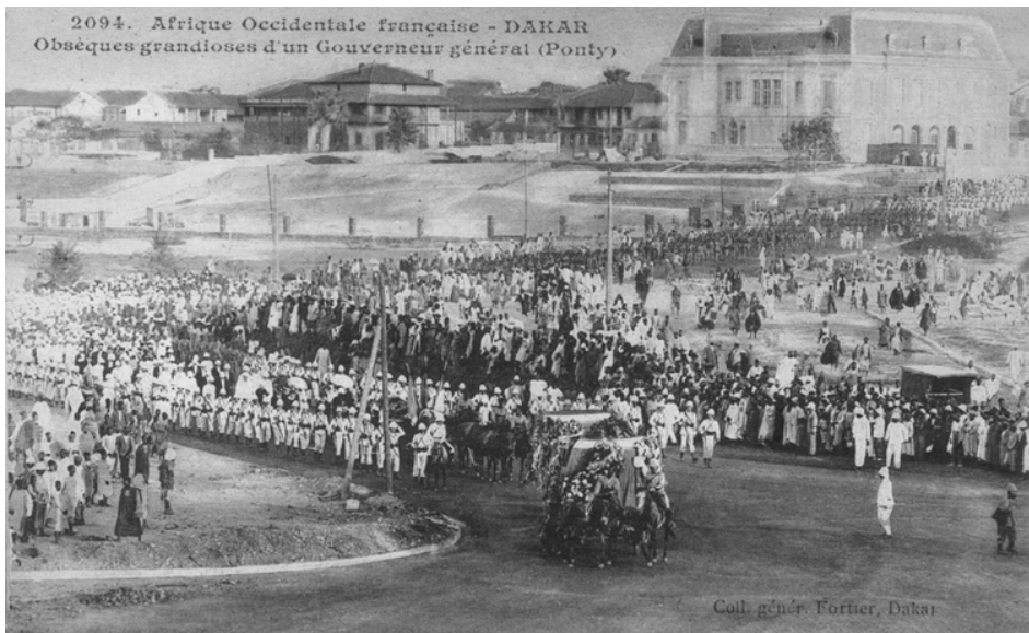
Les obsèques de William Ponty à Dakar le 15 juin 1915 (Carte postale de Fortier)