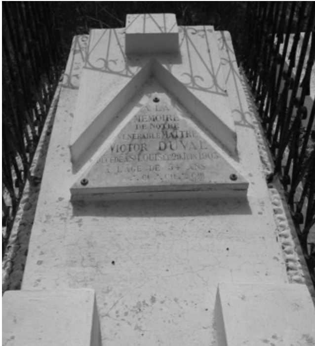
Tombe maçonnique de Victor Duval à Saint-Louis du Sénégal (Cimetière de Sor - Saint-Louis)

1876-1902 : c'est à peu près exactement la période où le Frère Victor