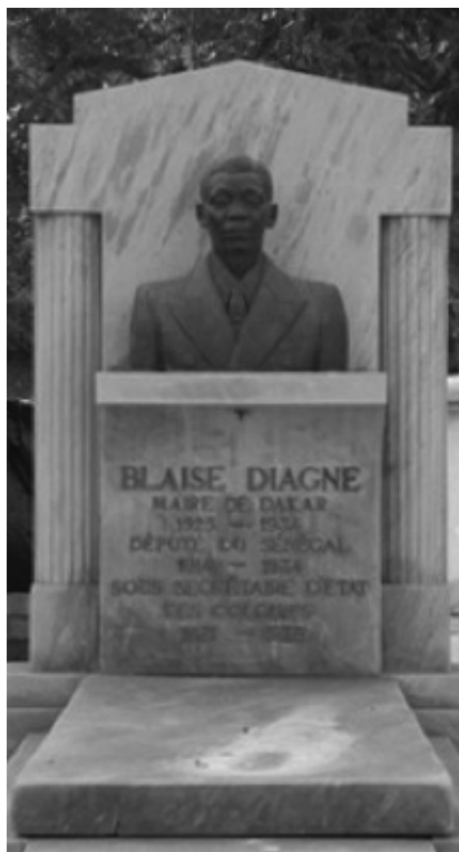
Tombe de Blaise Diagne à Dakar (Cimetière de Soumbedioune - Dakar)

liste des francs-maçons de 1936 le signale comme 30 e ; il signait déjà 30 e en 1923.