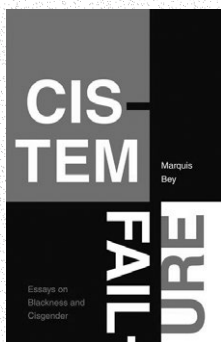
Marquis Bey, Cistem Failure , Duke University Press, 2022

If only we knew we could move. Even when chained in the hold, on the gang, to the fence, there is always a little wiggle room. Room to wiggle, those minute tremulous reverberations, is when the trap gets worked and where the work is another way to say I am (not), I am (not), I am (not).