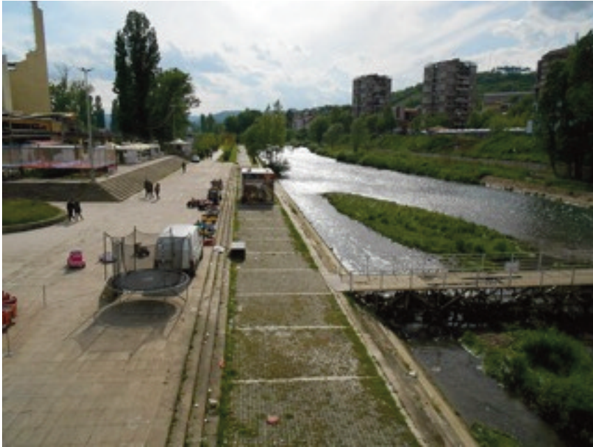
La rivière Ibar, côté sud.

des habitants à la ville en termes de « dynamiques frontalières » nous a permis de regarder les mobilités et les négociations identitaires qui se construisent dans l'espace urbain à partir de la relation avec l'autre. Les récits de vie, les histoires individuelles et les différences générationnelles aident à ne pas tomber dans le piège anthropologique de la transformation de « ce que les gens font en ce que les gens sont 32 ». Ainsi, la contextualisation des rapports sociaux par l'outil de l'enquête ethnographique nous libère d'une lecture exclusivement ethnicisée de la ville en nous permettant de comprendre les usages possibles et stratégiques des identités dans une situation urbaine de post-conflit.