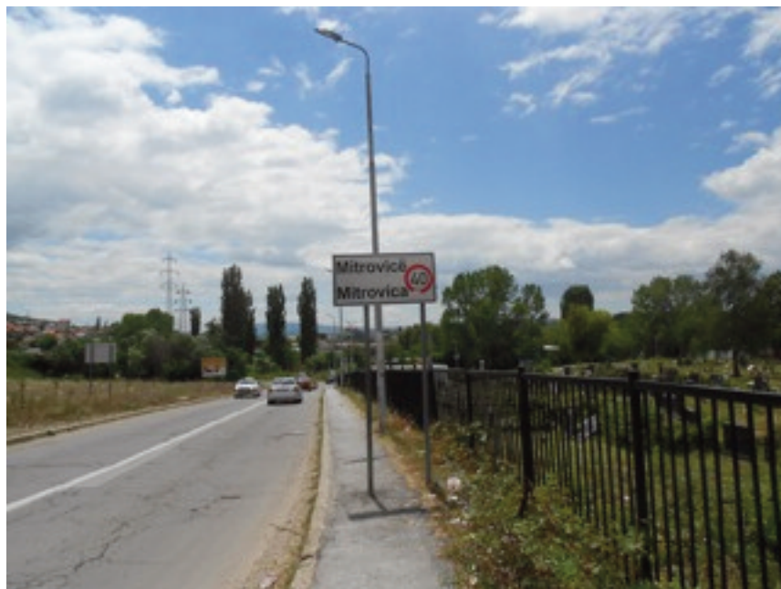
Mitrovicë/Mitrovica.