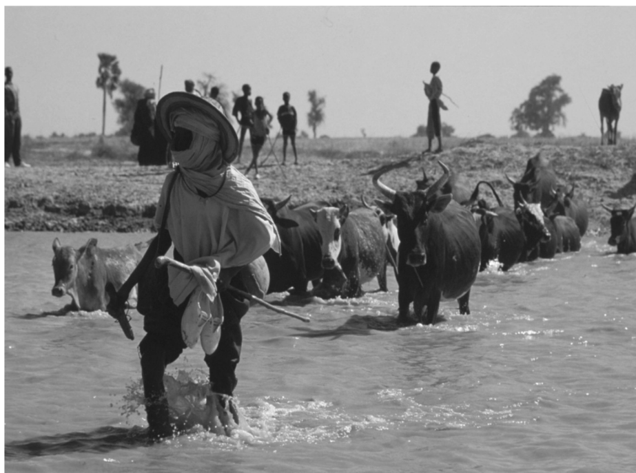
Scène d'élevage dans le delta intérieur du fleuve Niger, © IRD – Indigo, Olivier Barrière.

Face à l'évolution des enjeux d'ordre écologique, économique et social autour des ressources naturelles, les questions de patrimonialisation 1 occupent une place