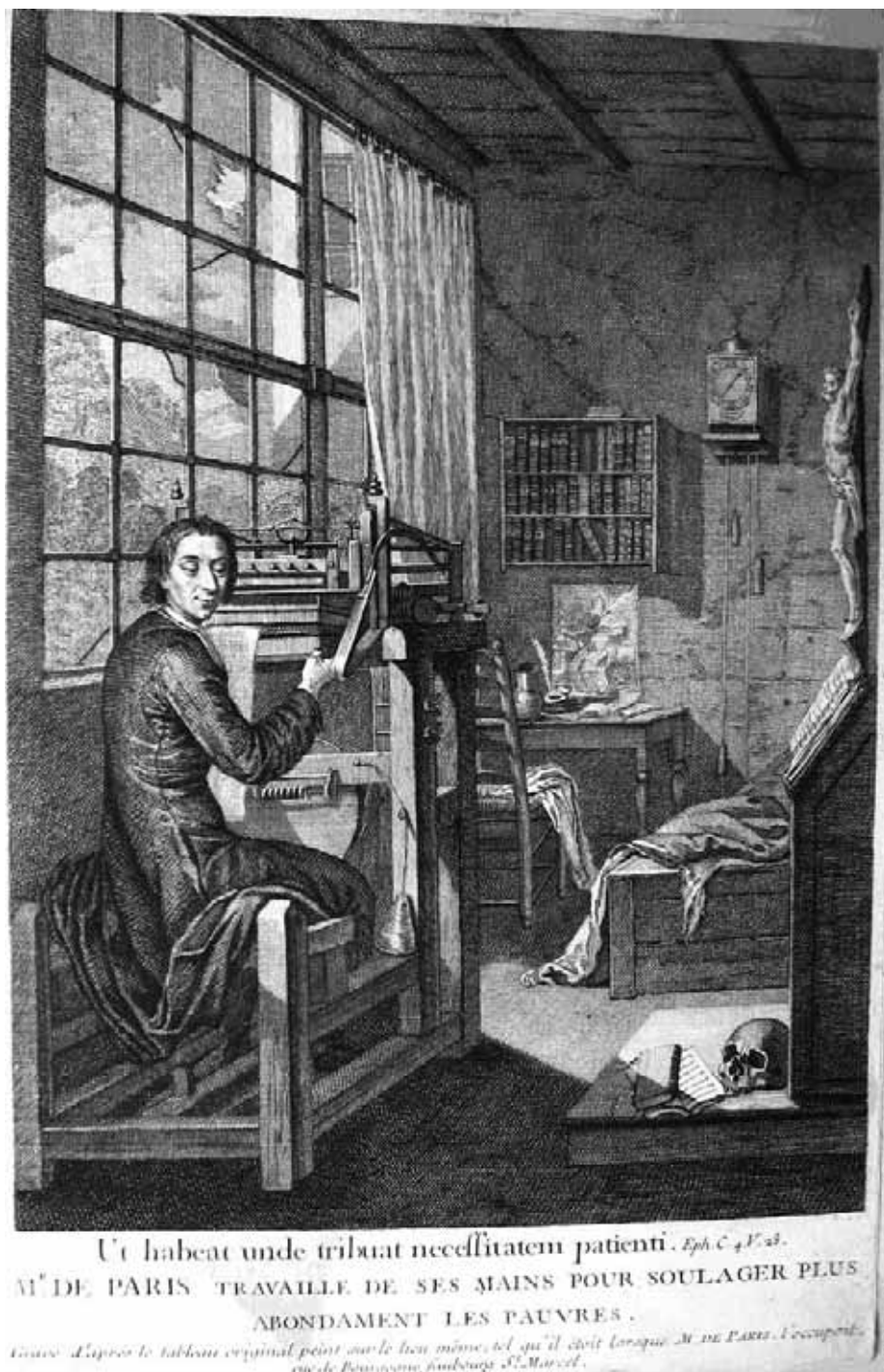
Figure 1. D'après Bernard Picart, Le diacre Paris faisant des bas, Suite de la vie du diacre Paris, vers 1730.