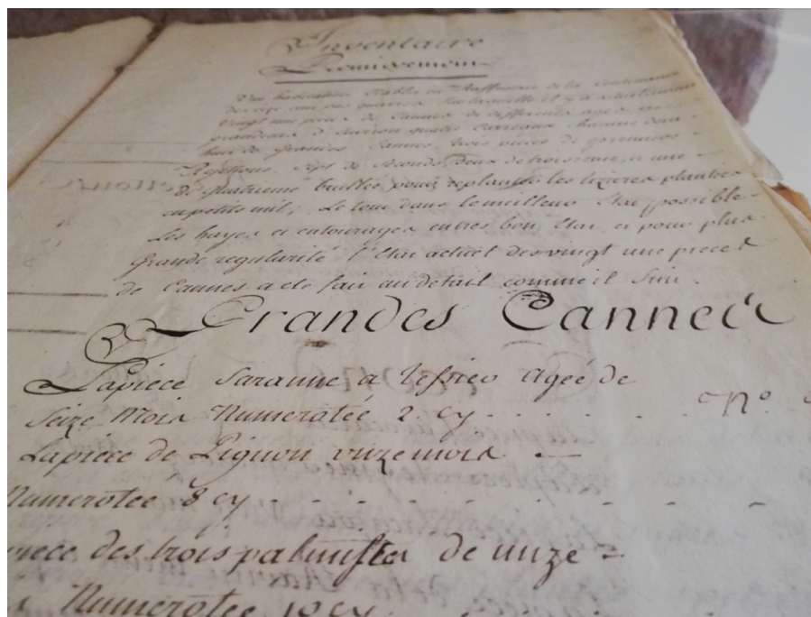
Figure 2 — Extrait de l'inventaire de l'habitation Le Bonnet, conservé aux AD90 (1J1127).