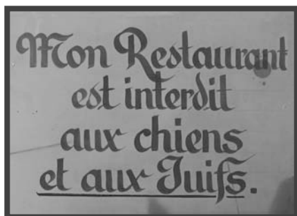
Affiches antisémites apposées dans une brasserie de Strasbourg, fin 1938.